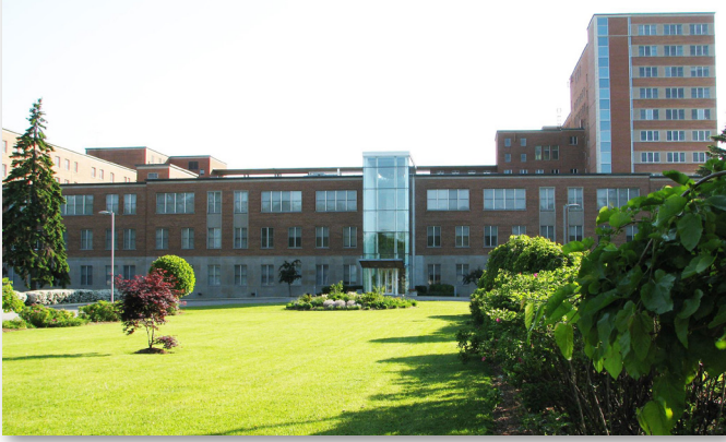
Centre International Providence, 12 055, rue Grenet, Montréal.

Le bâtiment étant devenu trop grand pour elles seules, les sœurs le quitte définitivement le 1 er juillet 1978. Il est vendu le 9 avril 1979 à la Corporation d'hébergement du Québec qui laisse la disponibilité de quelques locaux, incluant la chapelle, au Service social des sourds-muets. Les Sœurs de la Providence continuent leur implication auprès des sourds, principalement avec les personnes âgées, dans l'arrondissement Cartierville.