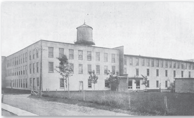
Victoriaville Furniture, Victoriaville, 1930.