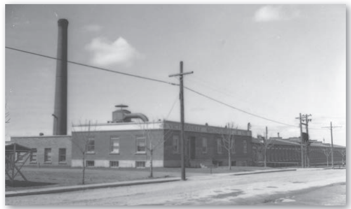
Victoriaville Specialties, Victoriaville.

L'usine de chaises devient Victoriaville Chair Manufacturing en février 1911. En 1913, elle loge un atelier, une chambre de finition et un entrepôt. Deux séchoirs de deux étages et une cour à bois sont adjacents à la manufacture qui emploie 75 ouvriers produisant annuellement 150 000 chaises. En mars 1916, après une liquidation financière, le tout passe aux mains de Canadian Rattan Chair.