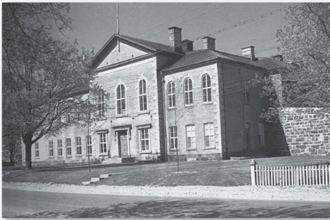
Premier palais de justice

d'environ 193 familles. Ces avocats et notaires s'installaient autour des lieux de travail qu'étaient les palais de justice et le bureau d'enregistrement.