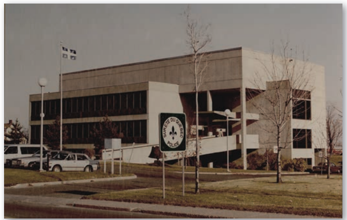
Deuxième palais de justice

Même si l'édifice n'a plus la prestance qu'il avait à une certaine époque, il joue toujours son rôle de pôle d'attraction et de lieu de rencontres citoyennes importantes.