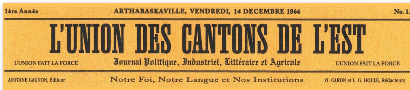
L'entête de la première parution de L'Union des Cantons de l'Est , le 14 décembre 1866.

De janvier à mars 1867, ce sera une lutte à finir entre L'Union des Cantons de l'Est et Le Défricheur . Les accusations et les attaques se multiplient. Le 14 février, L'Union des Cantons de l'Est publie trois textes pour s'en prendre à son concurrent qu'il accuse d'être « hors d'ha-leine et poussé au pied du mur », de ne pas respecter l'Évangile et d'être contre l'Église catholique. La semaine suivante, le journal écrit : « Pauvre Défricheur , qu'il est à plaindre », en faisant allusion à des critiques contre le gouvernement. Le Défricheur de Laurier ne mâche pas ses mots lui non plus et soulève la colère du curé Suzor et de M sr Laflèche.