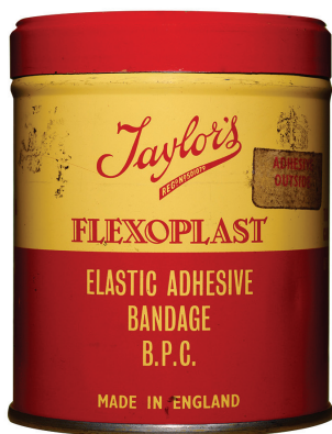
Boîte de pansement, date inconnue.

En 2007, le Centre universitaire de santé McGill (CUSM) se préparait à mettre en œuvre son projet de redéploiement selon deux objectifs. Dans un premier temps, il fallait intégrer trois hôpitaux universitaires, le Centre du cancer des Cèdres et l'institut de recherche dans un nouveau complexe hospitalier de fine pointe situé dans l'arrondissement Notre-Dame-de-Grâce, à Montréal. Par la suite, il s'agissait de réaliser la réfection de l'Hôpital de Lachine et de l'Hôpital général de Montréal. Dans ce contexte, le projet patrimonial du CUSM – devenu ensuite le Centre d'exposition RBC du CUSM – est né afin de préserver le patrimoine et la culture matérielle des hôpitaux du centre hospitalier lors des déménagements et des travaux de construction de ces établissements.