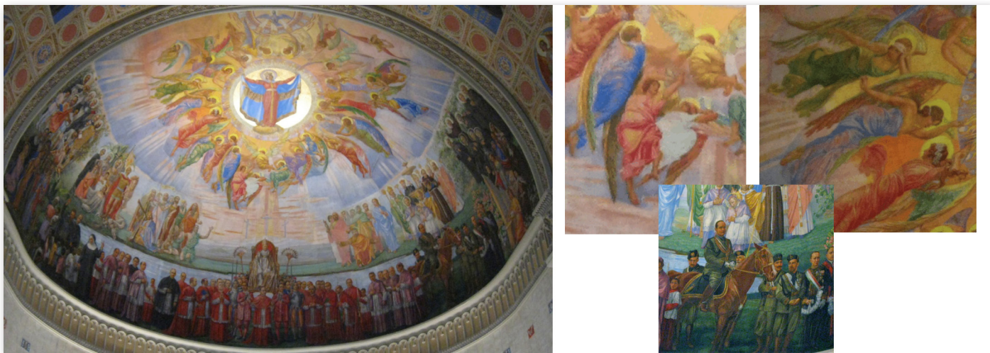
Fresque murale du chœur de l'église Notre-Dame-de-la-Défense (Montréal) et détails de celle-ci.