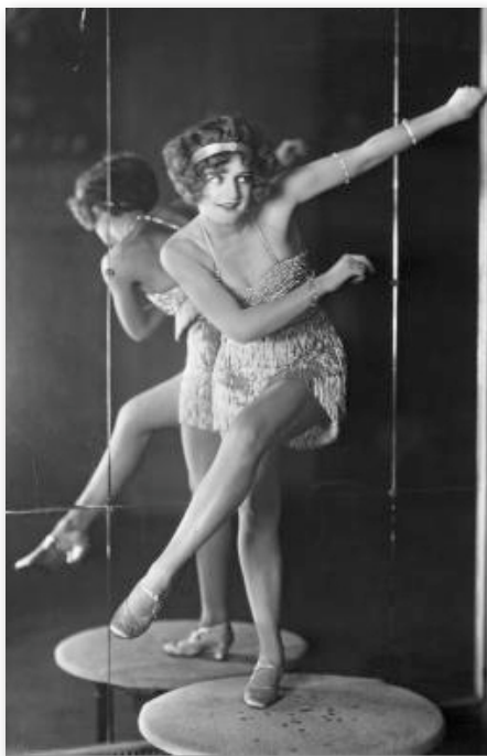
Pas de danse du Charleston.

d'honneur. Ce détail très discret mais pourtant visible depuis la croisée du transept se positionne dans une lecture « raphaélique » de la murale traditionnelle. Nincheri s'inspirait de l'artiste Raphaël, dont Michel Arasse écrit « par sa personnalité et le rôle qu'il joue dans la société romaine du moment, (Raphaël) est un témoin irremplaçable de la complexité vivante de cette situation 5 ».