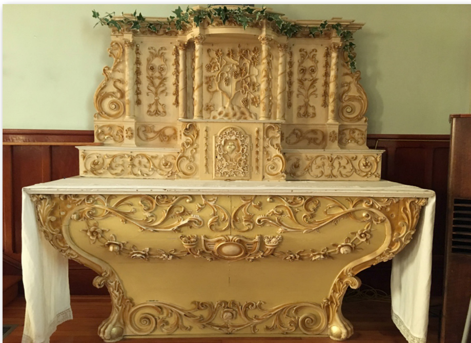
Autel latéral droit de Quévillon à l'église de Saint-Joachim-de-Shefford.

à Saint-Joachim-de-Shefford pour consulter les registres de la Fabrique. À la suite de cette démarche, c'est bien en 1932 que les autels ont été donnés selon le livre du Prône, mais surprise! vendus, la même année, par les Pères Dominicains à la paroisse de Saint-Joachim-de-Shefford dans un autre registre.