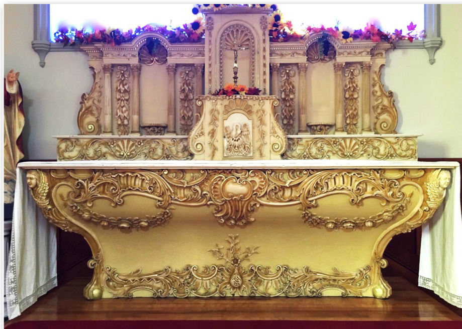
Maître autel de Quévillon à l'église de Saint-Joachim-de-Shefford.