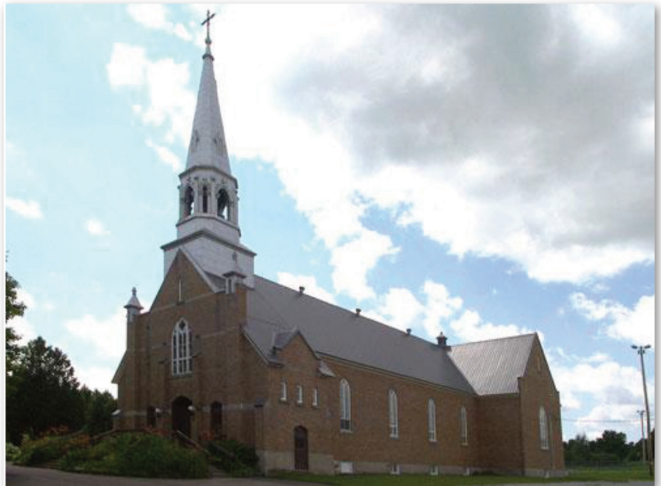
Église catholique de Saint-Joachim-de-Shefford, de 1932 à aujourd'hui.

Tout probablement des cierges mal éteints 5 . Devant ce nouveau malheur, les paroissiens décidèrent de reconstruire la même année, en 1932, au même endroit, une troisième église, cette fois-ci en brique. La Fabrique fit alors appel à des dons pour remplacer les objets liturgiques, les ornements sacerdotaux, la décoration, les autels et autres disparus dans le sinistre. Un grand nombre de paroisses environnantes, des institutions religieuses, des paroissiens et des curés répondirent à cet appel, dont les Pères Dominicains de Saint-Hyacinthe 6 . À