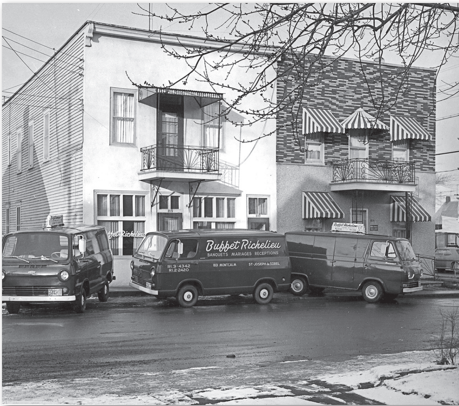
Siège social du Buffet Richelieu, Saint-Joseph de Sorel.

comté et ministre de la Défense au fédéral. Elle est alors responsable des cuisines, du service aux tables et du bar. Avant de vendre ses parts en 1965, elle gère une réception pour la Marine Industries avec invité d'honneur, l'honorable Jean Lesage.