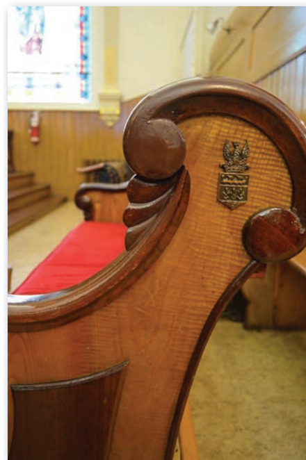
Le banc seigneurial des Joly de Lotbinière à Lotbinière. (Crédit photo : Benoît Grenier, septembre 2013)

Un second pan de l'analyse de la mémoire seigneuriale porte sur les lieux de mémoire seigneuriaux et agit en complémentarité avec les enquêtes orales. Existe-t-il une mémoire seigneuriale dans certaines localités? Dans l'affirmative, quelle mémoire est mise en valeur? « Réfléchir sur un objet patrimonial, c'est offrir une perspective sur la mémoire d'une communauté 4 . » Or, quels sont les lieux de mémoire seigneuriaux (moulin, manoir, plaques commémoratives, fêtes et traditions...)? Comment ceux-ci s'inscrivent-ils dans le récit historique local? Quelle fonction tiennent ces lieux seigneuriaux (lieux touristiques, centres d'interprétation, jardins, résidences privées...)? Sur quels acteurs et sur quelles périodes historiques met-on l'accent? L'analyse confrontera la mémoire et l'histoire de ces lieux.