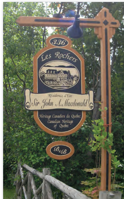
Enseigne du gîte « Les Rochers », résidence d'été de Sir John A. Macdonald, au 336, rue Fraser.

Sur la rue Fraser à St. Patrick, outre John Macdonald au 336, le premier ministre Louis Saint-Laurent a habité au 342, pendant plusieurs étés, de 1950 à 1971. En plus des gouverneurs généraux Lord Monck et Lord Dufferin, Jeanne Sauvé a séjourné au 331. La banlieue ouest de la ville de Rivière-du-Loup peut, à juste titre, revendiquer l'honneur d'avoir été la capitale d'été du Canada.