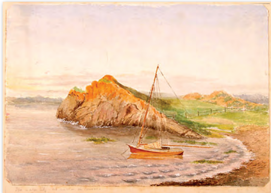
Aquarelle réalisée par Lady Agnes à Rivière-du-Loup. 11

Tous les dimanches, la famille Macdonald se rend à Fraserville pour assister au service à l'église anglicane St. Bartholomew, à laquelle Lady Agnes, tournée vers la religion et l'ascétisme, accorde son patronage pour ses bonnes œuvres. Un fauteuil est