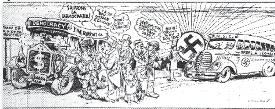
Caricature du Fasciste canadien , vol. 3 n° 11, avril 1938, première page.