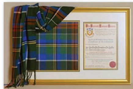
Les CFQ ont aussi créé leur tartan à l'occasion de leur 80 e anniversaire. Il est accrédité par le Council of the Scottish Tartans Society.

Les CFQ ont parcouru un long chemin, ils défendent toujours l'idéal pour lequel ils ont été créés. Leur histoire est riche, et on doit reconnaître leur apport dans la société