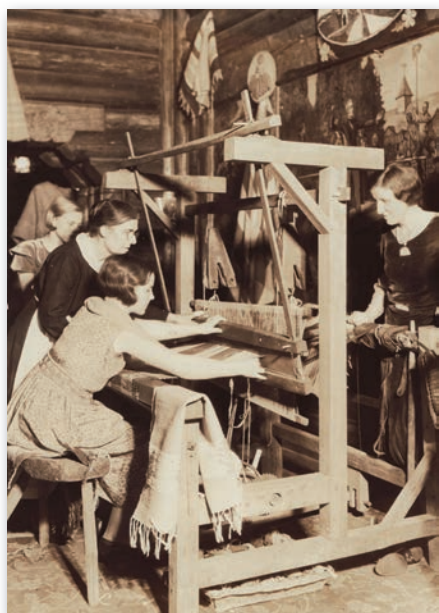
Travaux de tissage de 1915 à aujourd'hui.

Trois raisons essentielles poussent les femmes à se joindre à un Cercle : la maîtrise du métier à tisser, l'intégration aux activités sociales de la paroisse et la dynamique régionale de l'association.