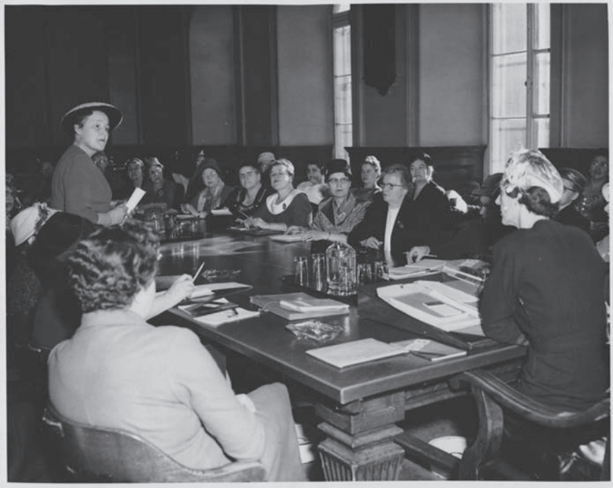
Année 1950, discussion au niveau provincial.

Les Cercles de Fermières seront le roc sur lequel pourra s'édifier la restructuration économique. Voici quelques initiatives intéressantes : l'achat des produits de chez nous, une campagne pour une meilleure nutrition, la mise sur pied de bibliothèques dans les