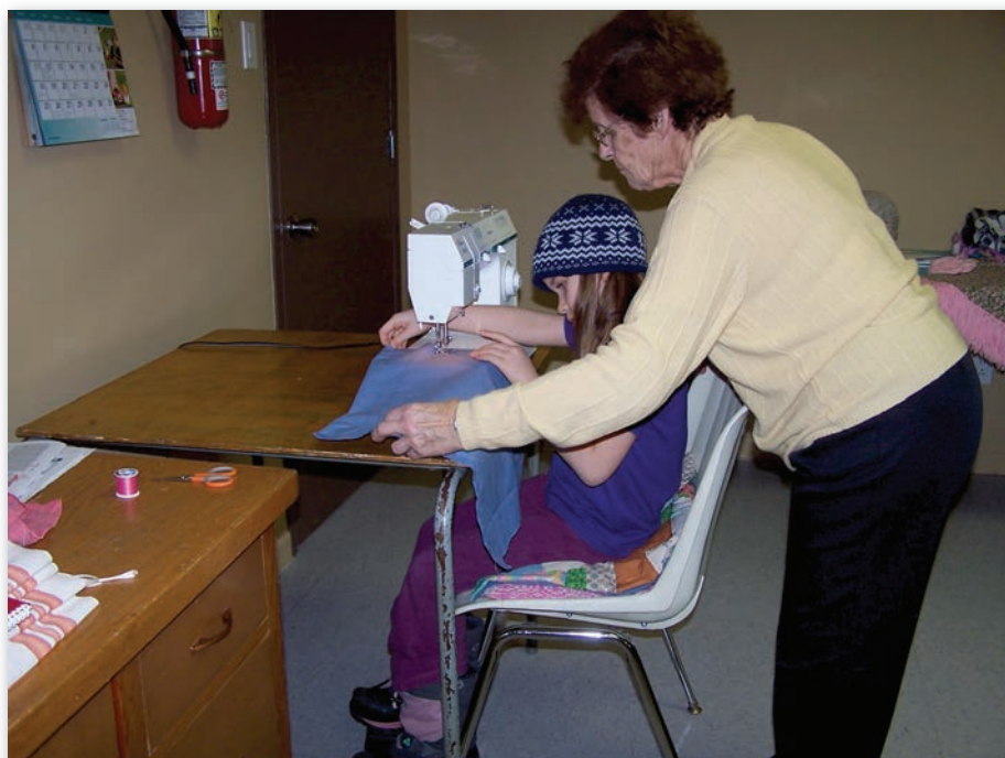
Volet jeunesse, transmission du patrimoine en couture.

Des jardins coopératifs sont créés et entretenus par les membres, la construction de poulaillers est favorisée,