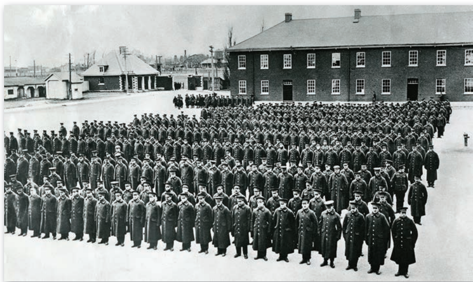
22 e Bataillon canadien-français à Saint-Jean, 1915.