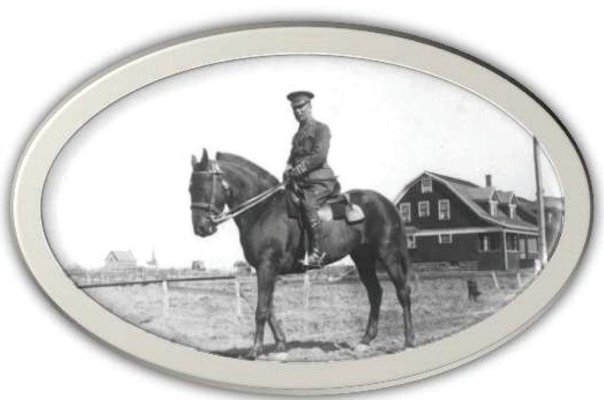
Charles Tariou de Lanaudière pose ici sur son cheval à Amherst, en Nouvelle-Écosse, en 1915.