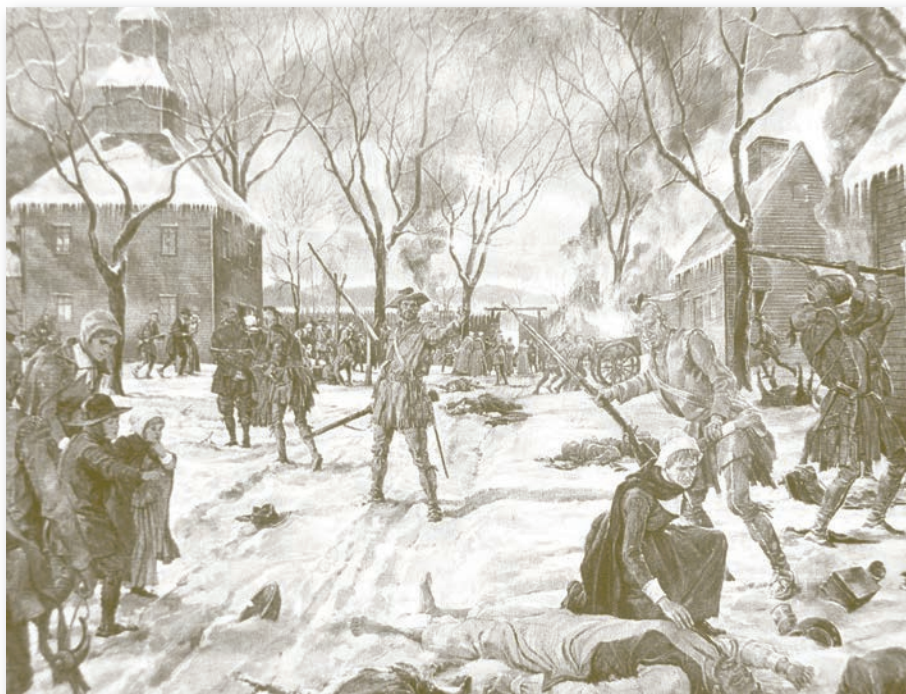
Les Abénakis participent au raid du 12 mars 1704 sur Deerfield au Massachusetts, sous le commandement de Jean-Baptiste Hertel de Rouville.