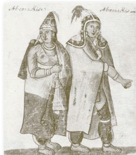
Illustration d'un couple Abénakis.

Le territoire des Abénakis de l'Ouest a longtemps été disputé par les Mohawks ou Agniers, l'une des cinq nations de la Confédération iroquoise 5 , établis sur la rive occidentale du lac Champlain dans ce qui est aujourd'hui l'État de New York. En 1609, Samuel de Champlain remonte la rivière Richelieu 6 jusqu'au lac auquel il donne son