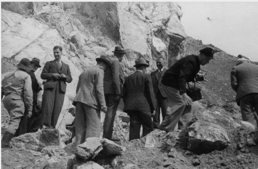
Groupe d'industriels allemands à la mine British Canadian.

« Ils ont entre autre visité la mine King Beaver de l'Asbestos Corporation Limited, la mine Johnson et la mine Bell Asbestos à Thetford Mines, la mine Vimy