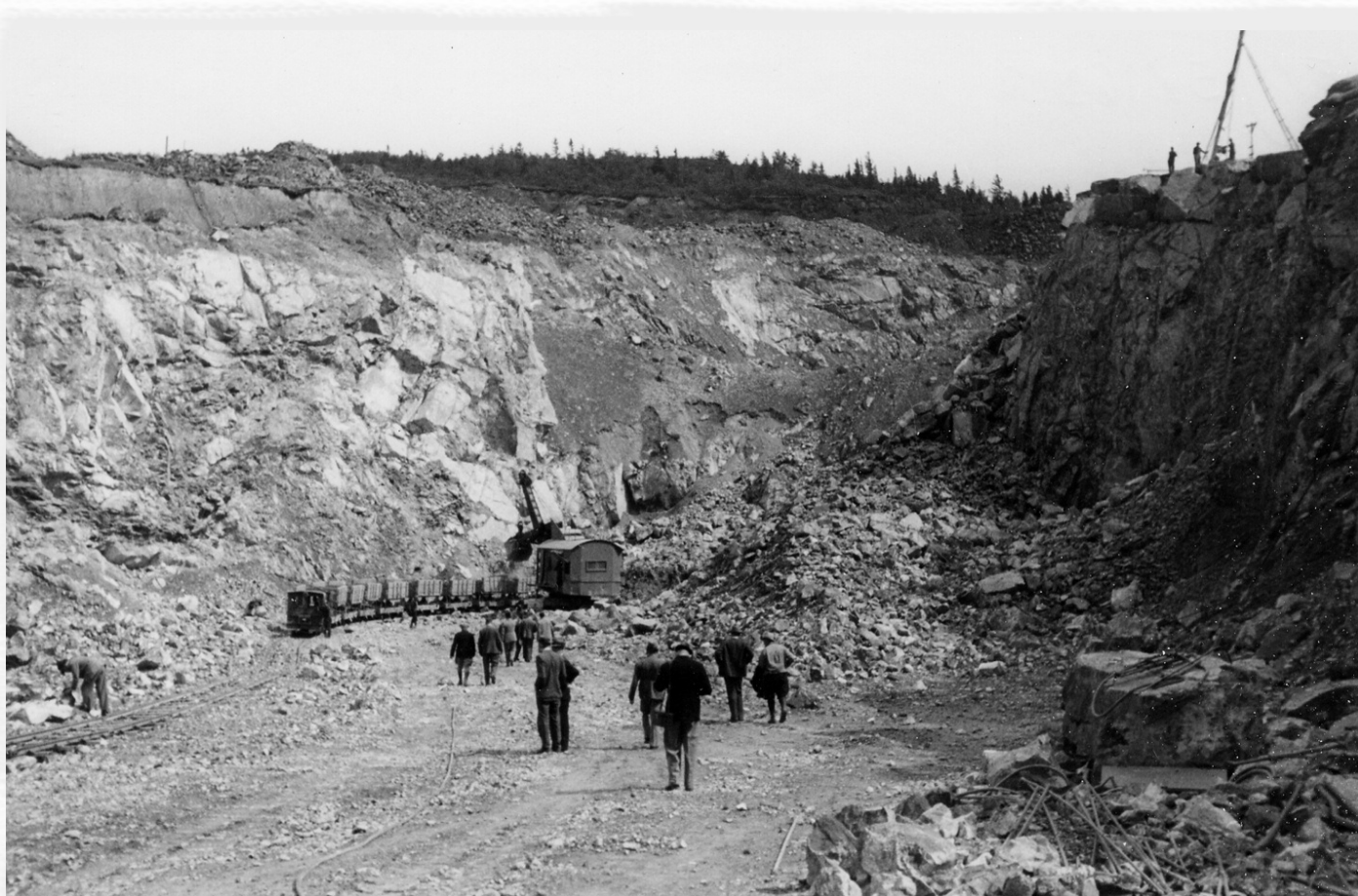
Visiteurs allemands dans le puits de la mine British Canadian.

De leur côté, les compagnies minières de la région de Thetford Mines ne démontrent aucun signe de malaise à traiter avec les entreprises allemandes. Au contraire, celles-ci ont permis à l'industrie de se relever d'années difficiles. Par exemple, la demande croissante de fibres d'amiante par l'Allemagne nazie permet à l'Asbestos Corporation de remettre en opération, en 1936, les mines Beaver et British Canadian fermées en 1929. De même, le prix du minéral et les profits enregistrés en trois ans, soit de 1936 à 1939, vont lui permettre d'effacer complètement une dette de 7 810 000 $ qu'elle avait contractée en 1926.