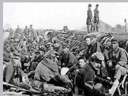
Soldats de la guerre de Sécession