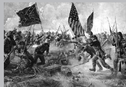
Guerre de Sécession.

Le présent article donne ici les grandes lignes des résultats de notre recherche qui se veut moins une histoire de la guerre civile américaine que celle des Canadiens français dans ce conflit. Chaque Canadien français ayant vécu une expérience unique, nous nous sommes attardés à relater celles qui ont permis d'aborder les différentes caractéristiques de leur participation à cette action historique.