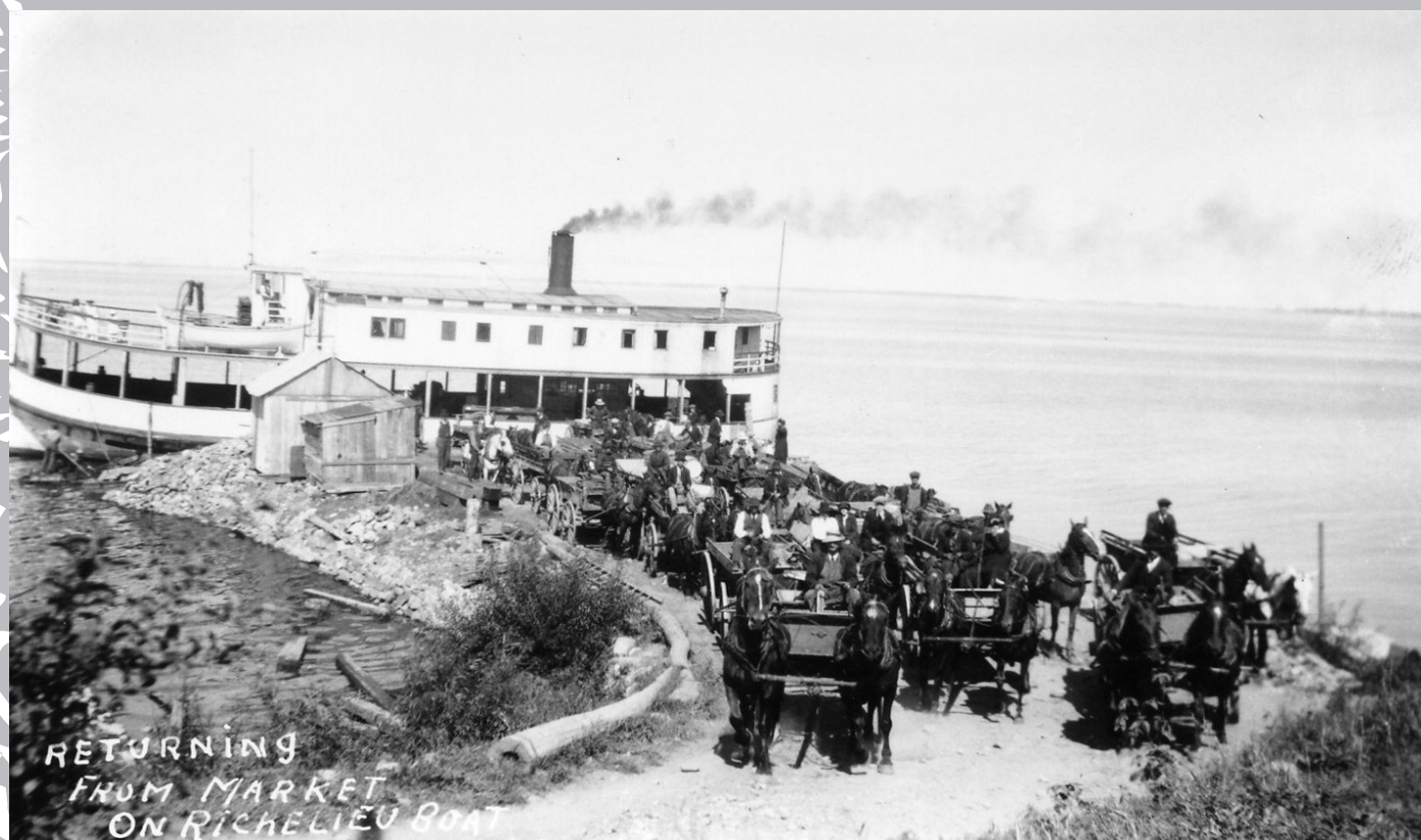
Traversier Richelieu accosté au quai La Tortue à Laprairie.

qui suivent, les demandes se renouvellent à Verdun, que ce soit par la même petite compagnie (12 mai 1888, Sainte-Catherine) ou par une nouvelle, comme elle de la Côte Saint-Louis (12 mai 1890) et de la Compagnie de Navigation de Verdun (24 août 1894). La même réponse se répète, et aux mêmes conditions. Chose remarquable, des profits plus grands sont retirés de Verdun que ceux provenant de la Rive-Sud. Ainsi, les permis coûtent 5 $, payables à Laprairie et 100 $ à Verdun.