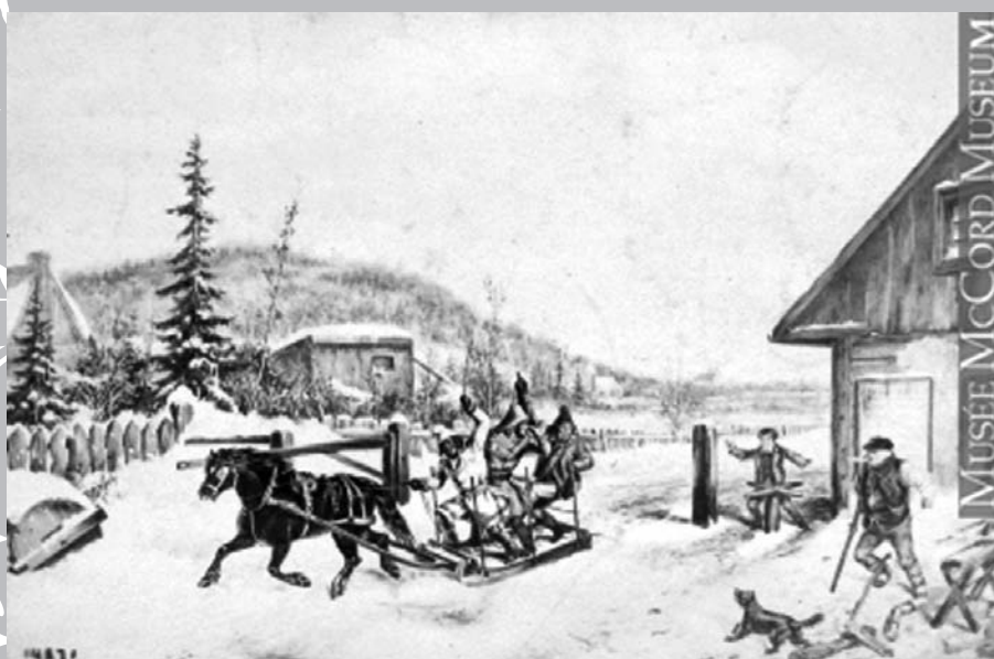
La barrière de péage, peinture de C. Krieghoff, copie réalisée en 1865. William Notman (1826-1891), 1865, XIX e siècle.