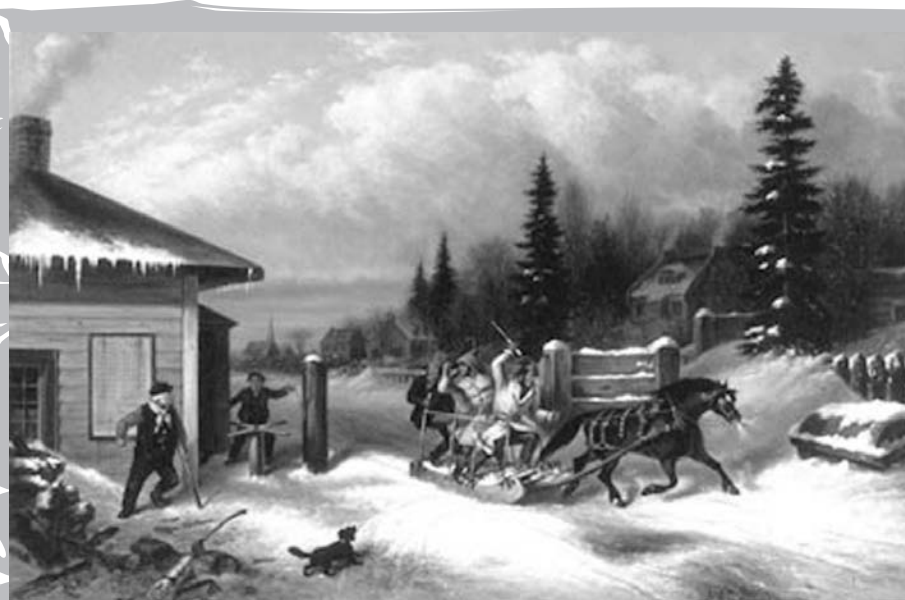
KRIEGHOFF, Cornelius, La barrière de péage , 1863, huile sur toile.

Corporation du comté de Chambly, chargée de l'entretien de ce chemin par le gouvernement provincial, supprime les quatre postes de péage.