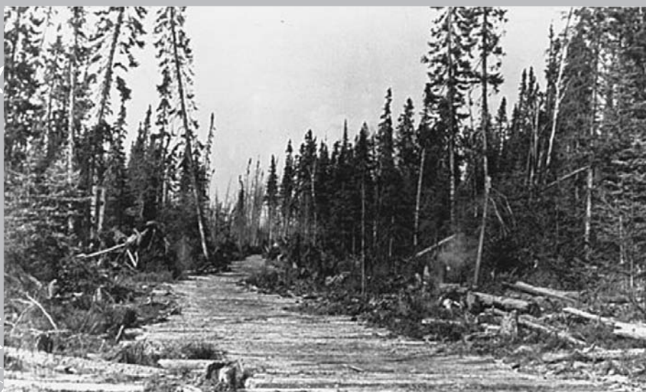
Illustration d'un chemin ponté.