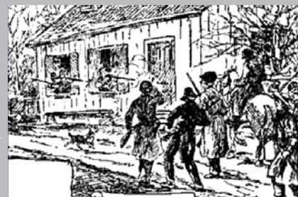
L'escarmouche de Booth's Tavern, 16 septembre 1837.

Les deux municipalités concernées, Longueuil et Chambly, suppriment le pavage de bois et macadamisent la chaussée à partir de 1858. Puis en 1889, la