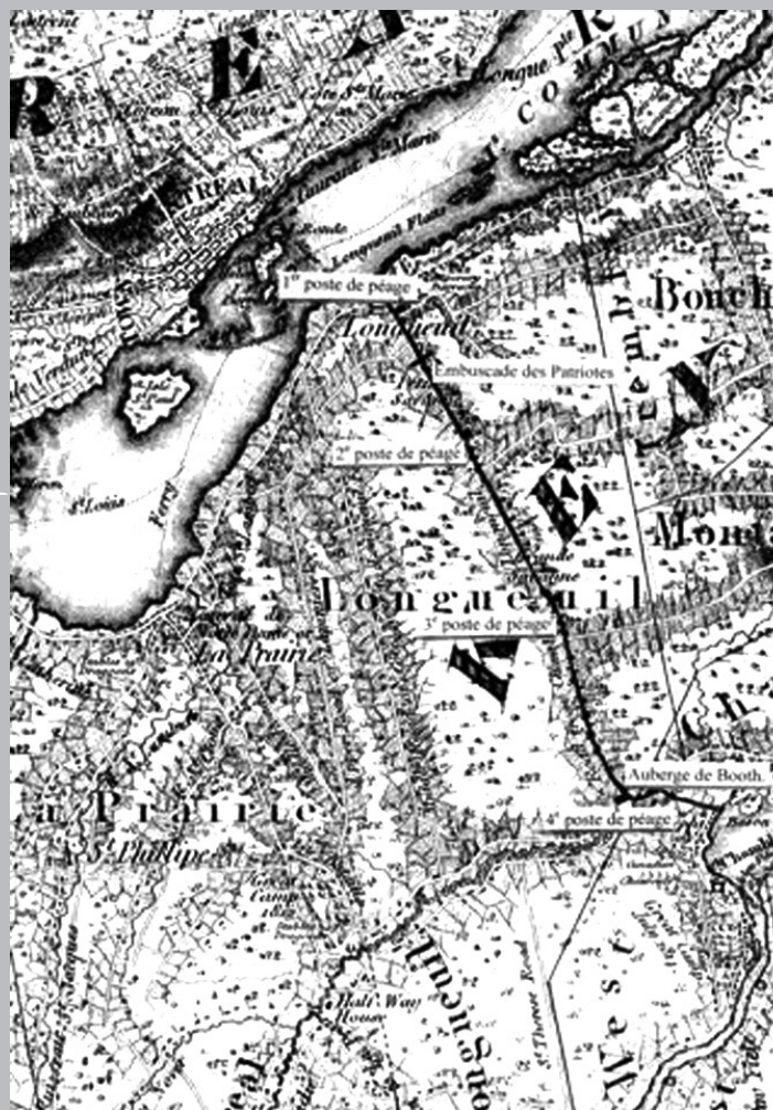
Sites approximatifs des quatre postes de péage, de l'embuscade des Patriotes et de l'auberge de Booth, sur le chemin de Chambly.

Ainsi ce chemin, d'abord militaire, abandonné à l'entretien seigneurial, confié ensuite à l'entreprise privée, remis aux municipalités puis transféré au gouvernement, avait rivalisé avec le transport fluvial et avec les chemins de fer. Que dire de l'entretien d'hiver et des rivières à franchir, comme le Richelieu, sur des ponts devenus fragiles et étroits pour les véhicules automobiles... Mais ça, c'est une autre histoire.