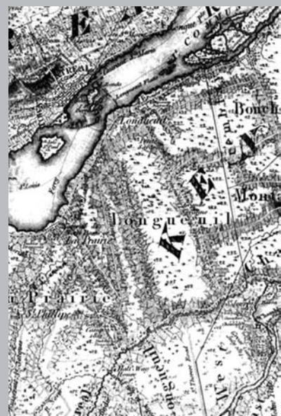
Carte topographique de la Province du Bas-Canada de Joseph Bouchette, 1815.

Quarante ans plus tard, après la Grande Paix de Montréal, il est à refaire : Sa Majesté approuve qu'on emploie les troupes cette année (1704) à faire des chemins dans les bois pour la commodité des habitants et qu'on commence par celui de Chambly à Montréal, qu'ils estiment le plus pressé. 3