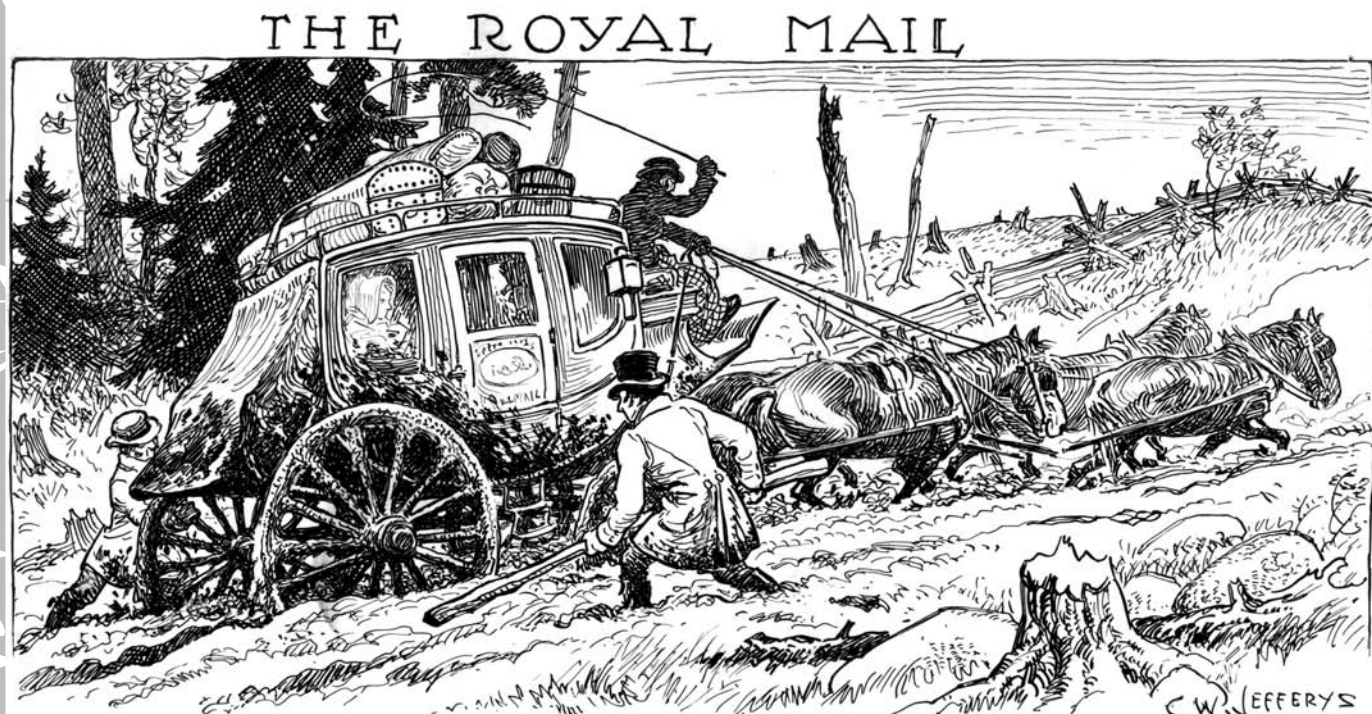
Royal Mail. Malle-poste embourbée. Pendant que le conducteur fouette ses chevaux, deux passagers qui pataugent dans la boue tentent de l'assister.

Les plus anciennes voitures connues au Bas-Canada roulent entre La Prairie et Saint-Jean en 1792 et 1793. En 1799, John C. Ogden, un voyageur étranger, emprunte la malle-poste de Saint-Jean à Montréal, puis celle de Montréal à Québec, qui circule