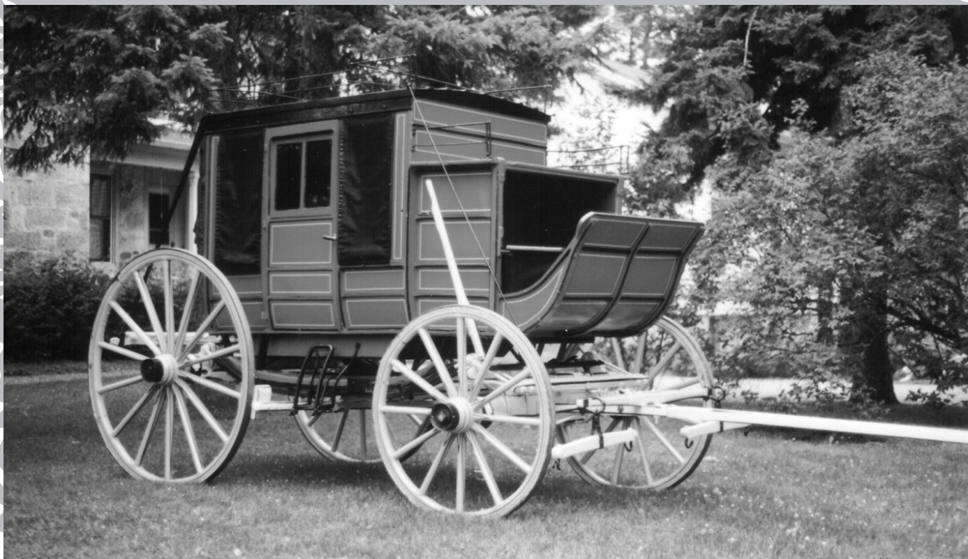
Diligence Concord utilisée à Stanstead vers 1890 et toujours en état de marche.

Les entreprises de diligences, encouragées d'ailleurs par les compagnies ferroviaires et surtout par le département des Postes, trouvent une nouvelle vocation à leurs voitures : celle d'assurer le transport de la clientèle ferroviaire et du courrier vers les gares et de desservir les arrières-pays trop peu peuplés pour justifier la construction de voies ferrées.