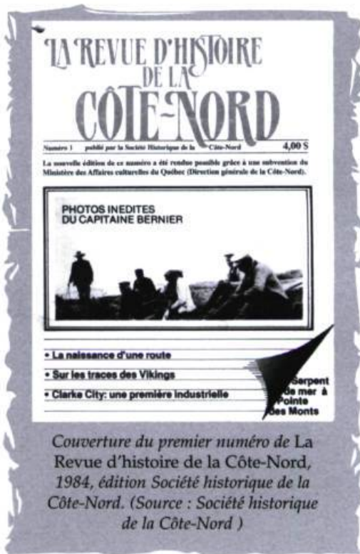
Couverture du premier numéro de La Revue d'histoire de la Côte-Nord, 1984, édition Société historique de la Côte-Nord.

Par écriture nord-côtière, on entend toute écriture qui évoque d'une façon ou d'une autre la Côte-Nord. Le concept d'écriture nord-côtière se définit par conséquent par rapport à un territoire. Ce « territoire-référent » se précise à travers trois grands espaces. Le premier est géographique : un littoral qui s'étend de Tadoussac à Blanc-Sablon. Le second, historique : plus de quatre siècles (des textes de Jacques Cartier aux plus récents, qui, dès les tout débuts, inscrivent dans leurs propos la rencontre avec les autochtones). Le troisième, d'ordre humain et culturel. Trois identités le construisent : autochtone, francophone et anglophone qui ont chacune leur histoire, leur culture et leurs écritures. Le corpus nord-côtier, exceptionnel par sa quantité, sa