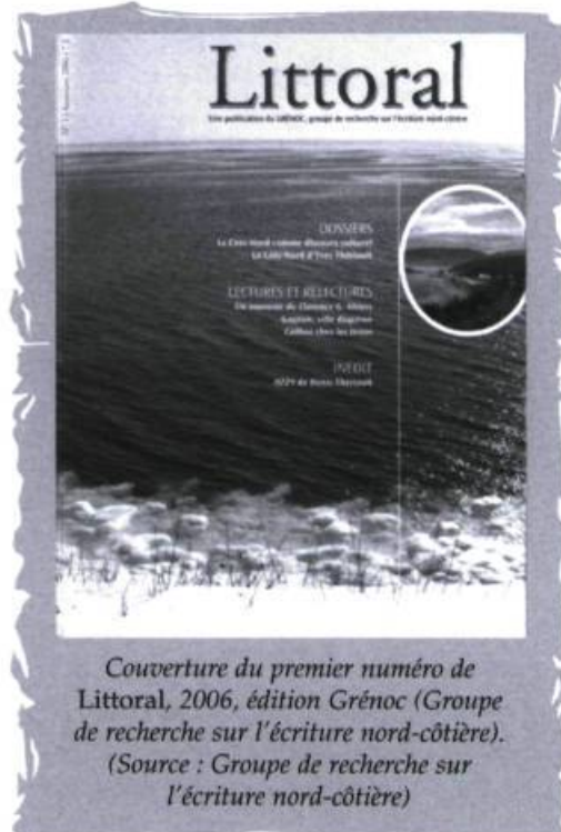
Couverture du premier numéro de Littoral, 2006, édition Grénoc (Groupe de recherche sur l'écriture nord-côtière).

longévité et sa diversité, est plutôt de genre qui fait voyager. L'écriture d'ici est d'abord redigée par des nomades avant de l'être par des sédentaires bien établis dans leurs lieux? Le premier