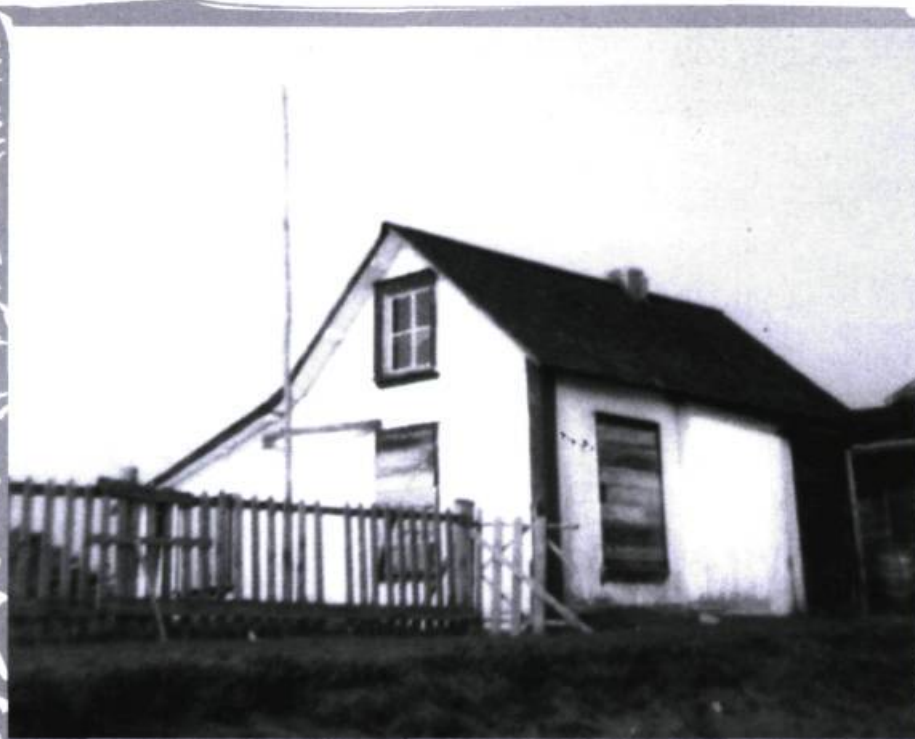
Prise en août 1946, cette photographie présente un ancien poste de la Baie d'Hudson, celui de Mingan, maintenant abandonné.