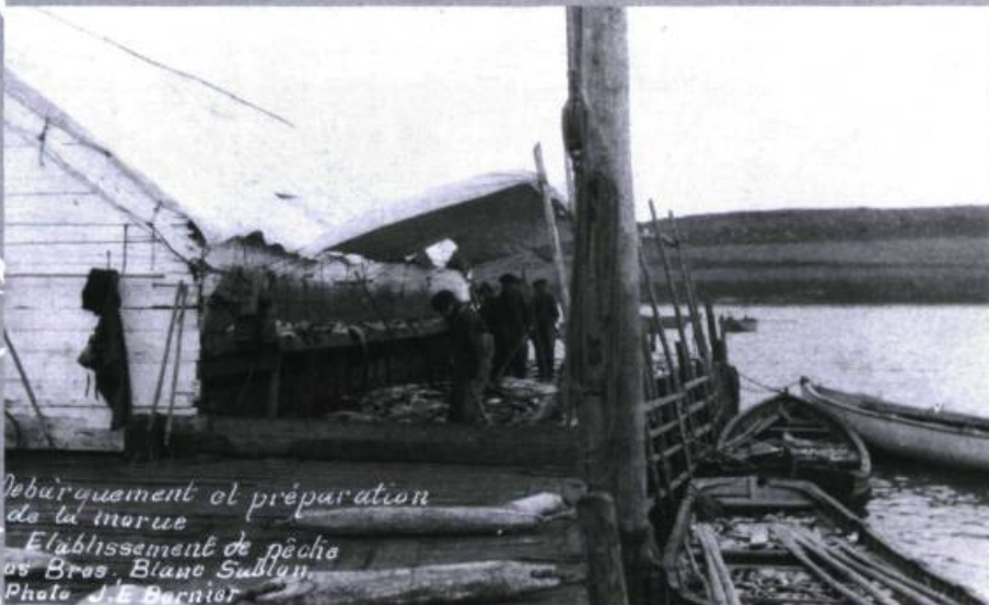
Débarquement et préparation de la morue Établissement de pêche des Bros. Blanc Sablon.

À partir des années 1870, c'est autour des comptoirs de ces grandes compagnies de pêche que se forment les premières communautés de la Minganie. Les compagnies construisent des bâtiments : maisons, coo-krooms (pour loger les pêcheurs saisonniers), hangars, entrepôts et magasins. Elles possèdent également leurs propres bateaux de pêche et leur flotte de navires marchands. Dès 1872, une goélette assure un service postal entre la Gaspésie, l'île d'Anticosti et la Côte-Nord durant la saison de navigation. « Les relations entre cette région et la péninsule de Gaspé se resserrent davantage. (...) La Côte-Nord est devenue une région d'émigration pour les Gaspésiens. » Grâce à toutes ces infrastructures, le peuplement de la région se consolide. Le nombre maximal de stations de pêche sur la Moyenne-Côte-Nord sera atteint vers 1875, avec un total de 30 établissements abritant chacun une population moyenne de 47 personnes.