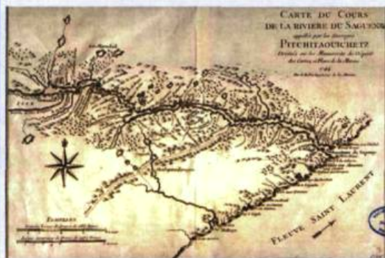
Carte du cours de la rivière Saguenay appelée (sic) par les sauvages Pitchitaouichetz, œuvre de Jacques-Nicolas Bellin, cartographe et ingénieur de la marine française.