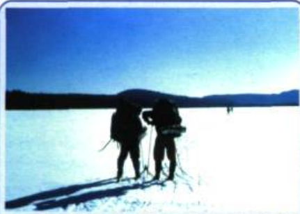
Le lac Long dans la partie centrale de la rivière Métabetchouan, direction sud. On aperçoit au loin le plateau supérieur des Laurentides.