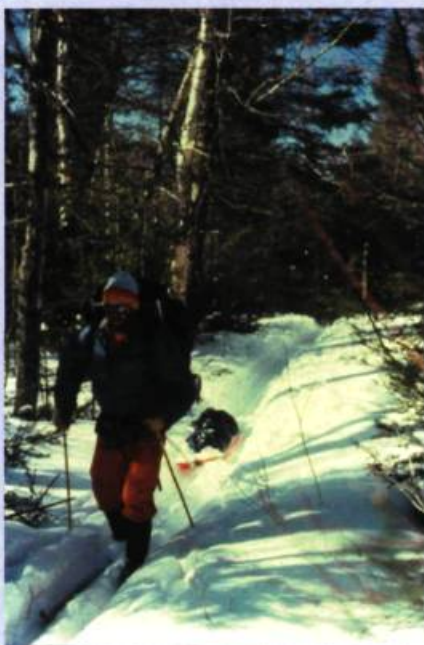
Le lac Long dans la partie centrale de la rivière Métabetchouan, direction sud. On aperçoit au loin le plateau supérieur des Laurentides.

En hiver, la marche en raquettes sur les surfaces enneigées ou