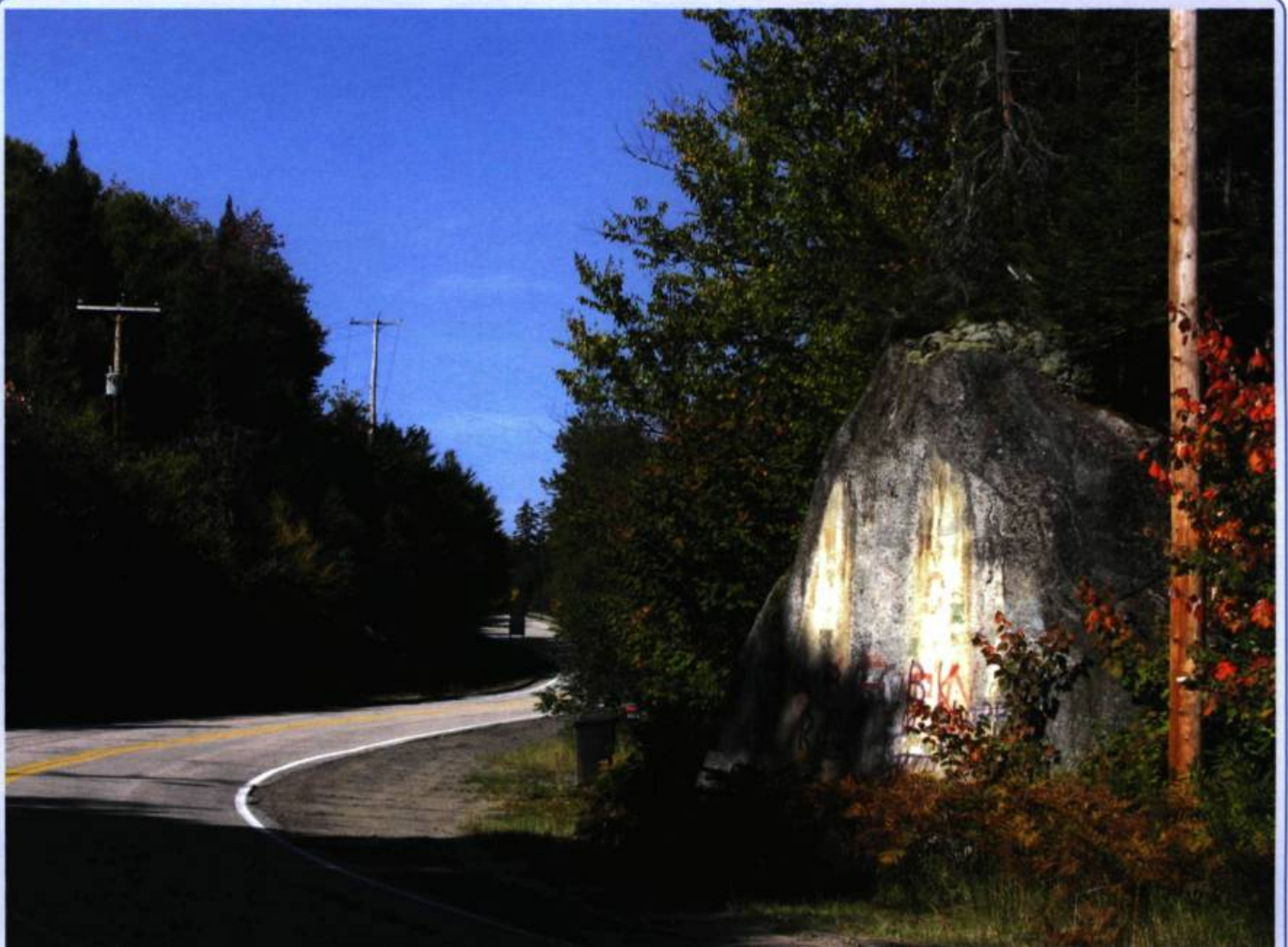
La Grosse Roche du lac Lagon, près du hameau de Tewkesbury à Stoneham : point de rencontre des Hurons-Wendats du village de Lorette (Wendake) avec les Innus-Montagnais des Laurentides et du lac Saint-Jean.