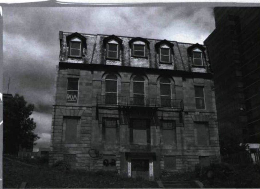
La maison LaFontaine, dans l'îlot Overdale, à Montréal. Construite dans les années 1830, elle constitue un exemple rare de l'architecture néo-classique en pierre des grandes villas du quartier Saint-Antoine. Elle servit de résidence au premier ministre du Canada uni Louis-Hippolyte LaFontaine de 1849 à 1864; le cabinet de l'époque y a même tenu des réunions. Elle a survécu aux actes de vandalisme et à l'incendie qui a rasé le Parlement du Canada (actuelle place d'Youville), alors dans ce quartier. Bien que citée par la Ville de Montréal en 1987, elle est abandonnée depuis plus de 20 ans.

notre fédération et ses différents membres ont non seulement préservé ce patrimoine mais exercé des pressions pour que le gouvernement québécois et les municipalités en fassent autant. On peut donc comprendre notre déception à la lecture du Livre vert . En effet, nous aurions espéré, à ce point-ci, être consulté sur un projet de loi concret plutôt que sur des énoncés plus ou moins flous. On aurait préféré être consulté sur une politique du patrimoine avec les grandes lignes d'un plan d'action plutôt qu'à propos de définitions du patrimoine sur lesquelles le milieu du patrimoine s'entend depuis longtemps, et certainement depuis le Rapport Arpin . Nous invitons du reste le lecteur à aller consulter les différents mémoires, déclarations