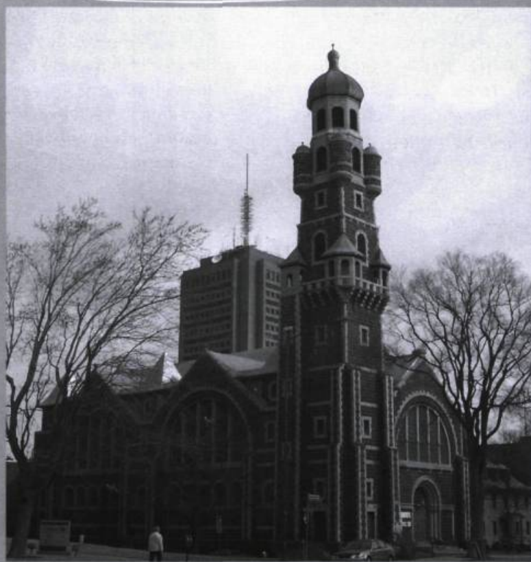
L'église Saint-Coeur-de-Marie, 530, Grande-Allée est, à Québec, fut construite dans un style architectural particulièrement original, le style romano-byzantin, qui évoque les premiers temps de la chrétienté et dont les voûtes de type Gustavino, notamment, font référence aux intérieurs des basiliques de la Rome Antique. À l'extérieur, le granite gris-rose, provenant de Rivière-à-Pierre, est également unique. Construite en 1919-1920, l'église fut ouverte au culte en 1921; la paroisse fut rattachée à la paroisse Saint-Dominique en 1986 et l'église vendue dix ans plus tard. Elle a connu certaines restaurations de sa tour en 1997, mais le reste tarde à venir.

vert de convertir la CBCQ en Conseil du patrimoine du Québec (CPQ) qui, justement, aurait cette indépendance d'action et permettrait un débat plus ouvert et plus transparent en matière de patrimoine culturel au Québec. Toutefois, pour qu'il puisse bien jouer son rôle, il faudrait :