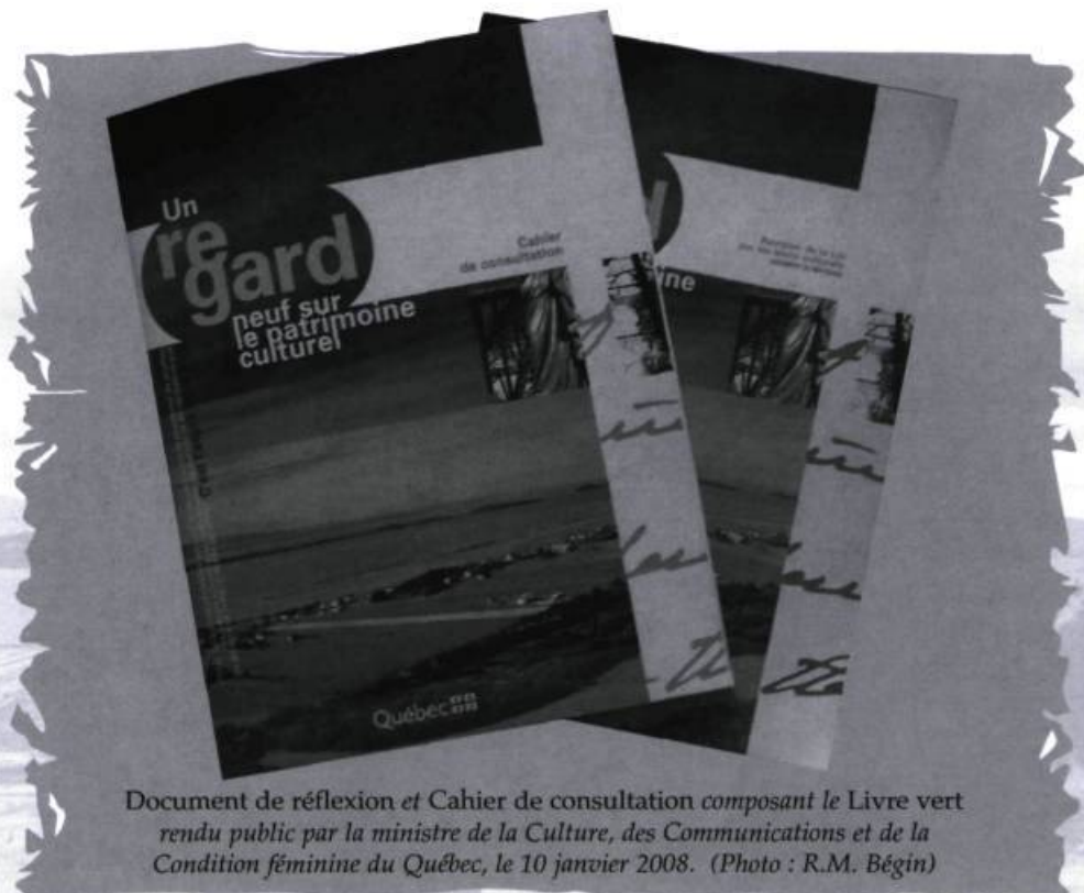
Document de réflexion et Cahier de consultation composant le Livre vert rendu public par la ministre de la Culture, des Communications et de la Condition féminine du Québec, le 10 janvier 2008.

Le Livre vert se compose essentiellement de deux publications. La première, un document de réflexion de 76 pages, nous présente un historique et fait en quelque sorte un bilan de l'état du patrimoine au Québec depuis l'adoption de la Loi sur les biens culturels en 1972. La seconde est un cahier de consultation de 28 pages, dont les 18 premières constituent un condensé du document de réflexion. « La proposition : vers une loi sur la protection du patrimoine culturel » ne couvre donc qu'une dizaine de pages et comprend principalement des énoncés, propositions et considérations sur lesquels les citoyens sont invités à se prononcer, notamment à l'aide de questions suggérées. On