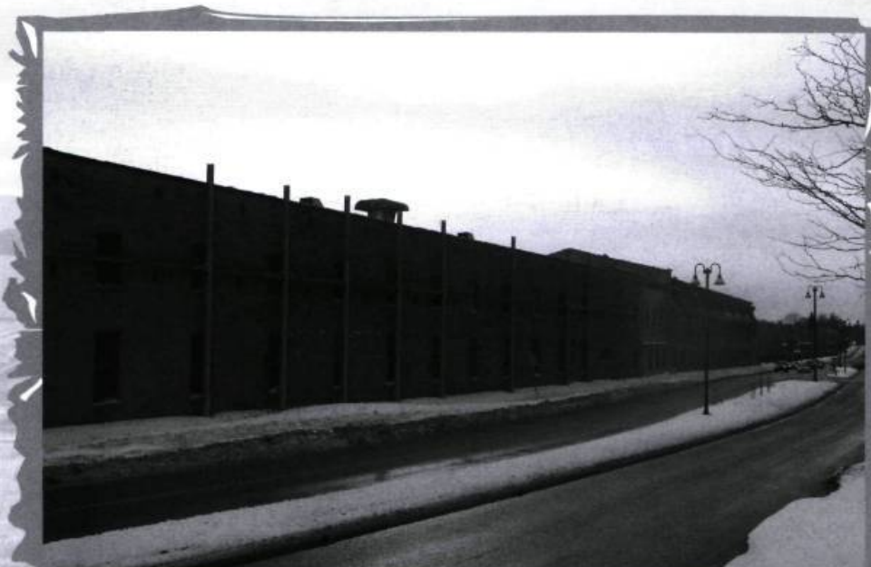
Les édifices E.B. Eddy (à l'angle de la rue Eddy et du boulevard Alexandre-Taché) à Hull ont été pendant plus d'un siècle au cœur de la vie industrielle de Hull, voire du Canada tout entier. Six de ces édifices construits entre 1883 et 1890 ont été finalement reconnus par la Loi sur les biens culturels du Québec en 2001, mais, depuis, on a vu surgir ces structures d'acier avec grillage à l'entrée du Grand Gatineau, des structures qui donnent l'impression que les bâtiments vont s'écrouler incessamment. Les bâtiments appartiennent à la Domtar.

Fondée en 1965 et regroupant présentement 202 sociétés membres à travers le Québec, la Fédération des sociétés d'histoire du Québec s'était fixé, dans ses actes constitutifs, les principaux objectifs suivants :