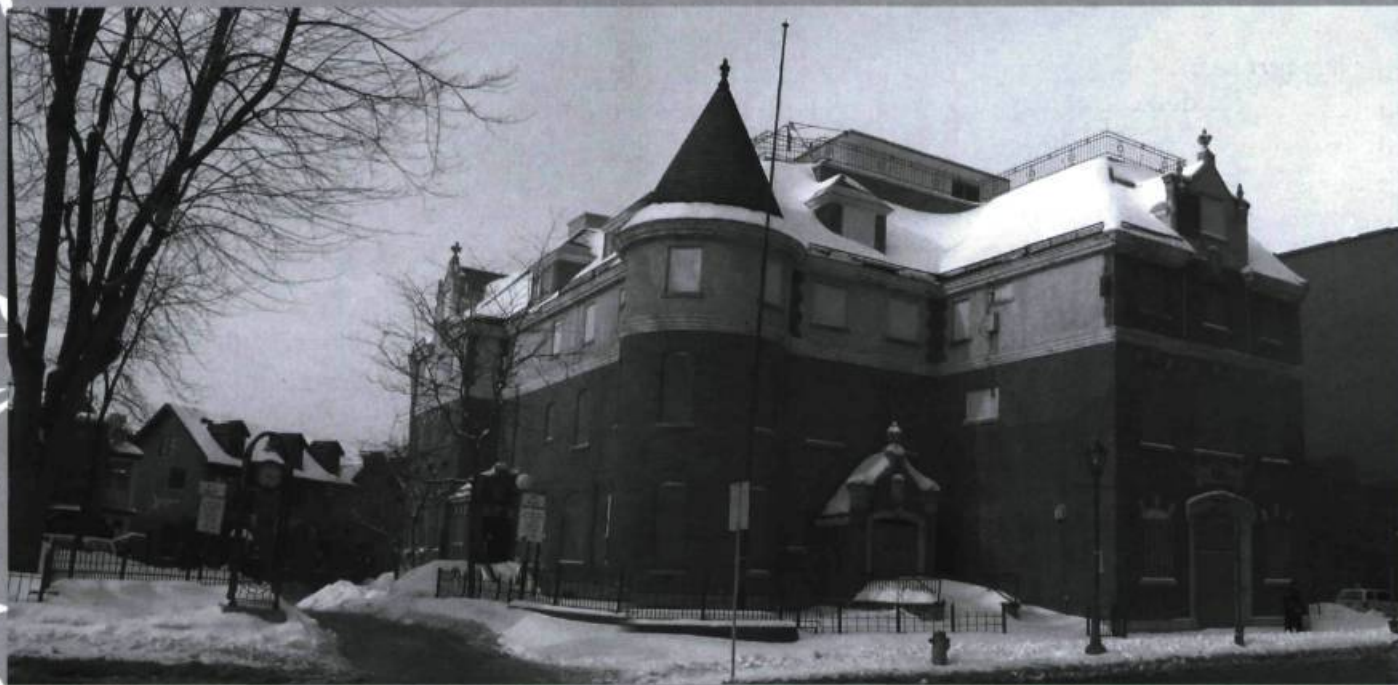
L'Hôtel Chez-Henri, 179, promenade du Portage à Gatineau, a été construit peu après le grand feu de Hull, en 1900 et a abrité pendant de nombreuses années un hôtel et un restaurant de grande classe. Bien qu'inclus dans le site du patrimoine Kent-Aubry-Wright de Hull constitué en 1991, le bâtiment a été grandement abîmé dans les années 1990, et il a été finalement cité individuellement par la Ville de Gatineau en 2003 pour en assurer une préservation plus adéquate.

Il est toujours à l'abandon et en état de détérioration croissante.