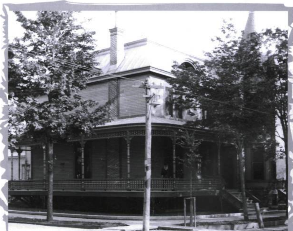
Maison Prévost en 1898. La galerie finement décorée représente une des caractéristiques du style néo-Queen Anne.

L'histoire de la maison Prévost se confond avec celle de l'hôtel de ville de Saint-Jérôme. La Ville, qui commence à prendre de l'importance, se trouve à l'étroit dans ses bureaux. En août 1918, elle loue la maison