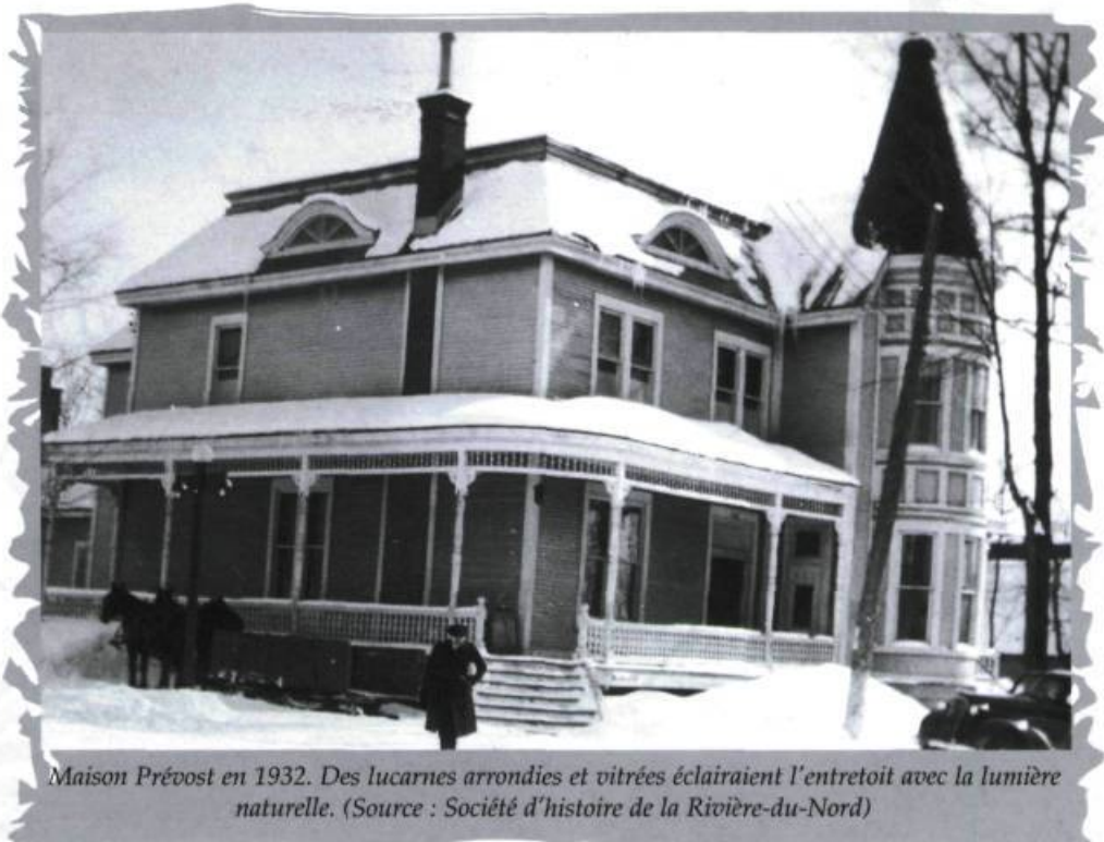
Maison Prévost en 1932. Des lucarnes arrondies et vitrées éclairaient l'entresol avec la lumière naturelle.

L'Unité sanitaire de Terrebonne avait été inaugurée à Saint-Jérôme en 1929. Ces établissements sanitaires, que le gouvernement du Québec mettait sur pied à travers la