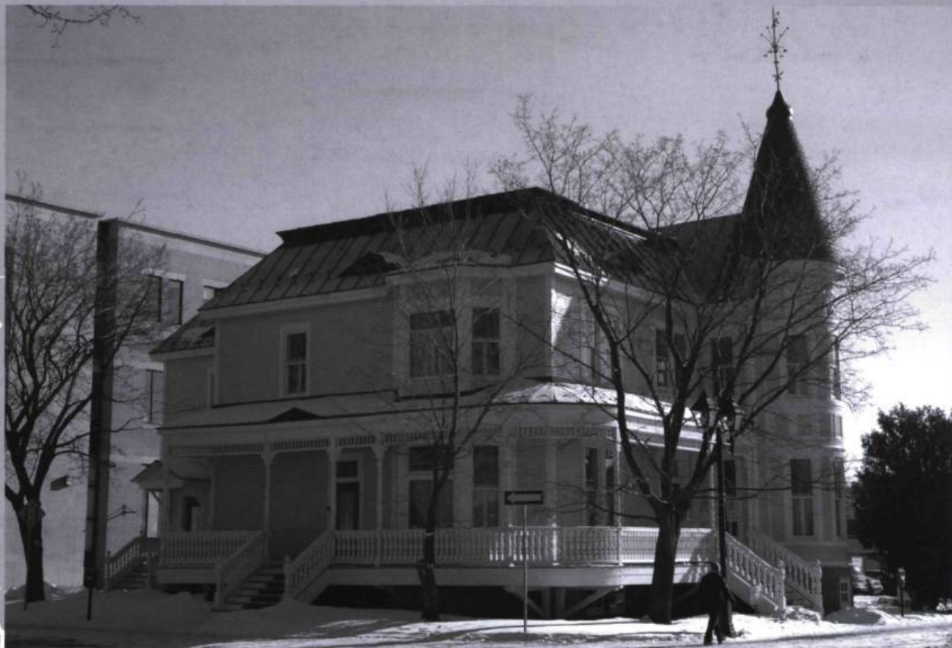
Maison Prévost en 2007. Elle représente indéniablement l'une des plus belles résidences d'intérêt historique et patrimonial de la ville de Saint-Jérôme.