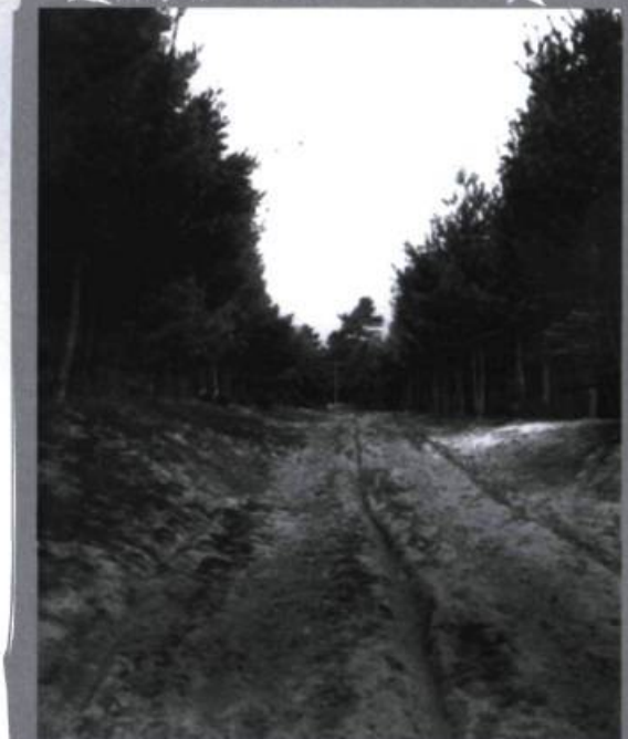
Rang L'Annonciation, en 1905.

entreprise écologique d'une grande envergure pour sauver un village.