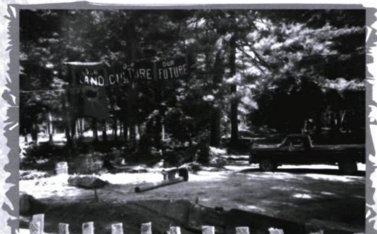
Avant la crise d'Oka, en 1990.

Toutefois, cent ans plus tard, cette forêt de pins était menacée par la main de l'homme qui l'avait érigée, tel un monument. D'un côté des hommes aux ambitions économiques voulaient faire disparaître la Pinède pour y agrandir leur terrain de golf et y construire des résidences de luxe. De