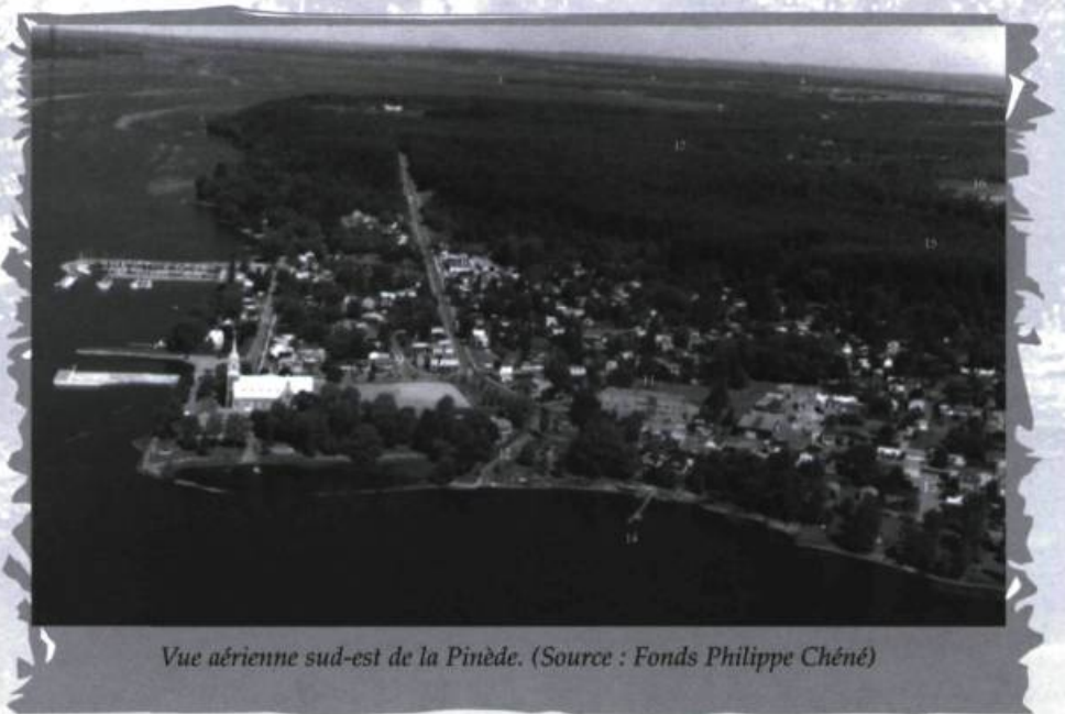
Vue aérienne sud-est de la Pinède.

Comme dans toutes les autres seigneuries, une partie de son domaine de la seigneurie du lac des Deux-Montagnes était réservée pour le pacage des animaux des habitants. Ce lieu était désigné par le nom de « commune ». Les agriculteurs payaient une redevance aux Sulpiciens pour l'utilisation de cette prairie. En 1815, les missionnaires confièrent l'entretien de la « commune » aux Iroquois