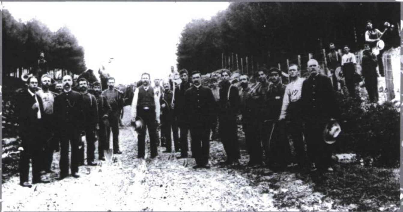
Travailleurs qui construisent les clôtures dans le rang L'Annonciation, en 1907.