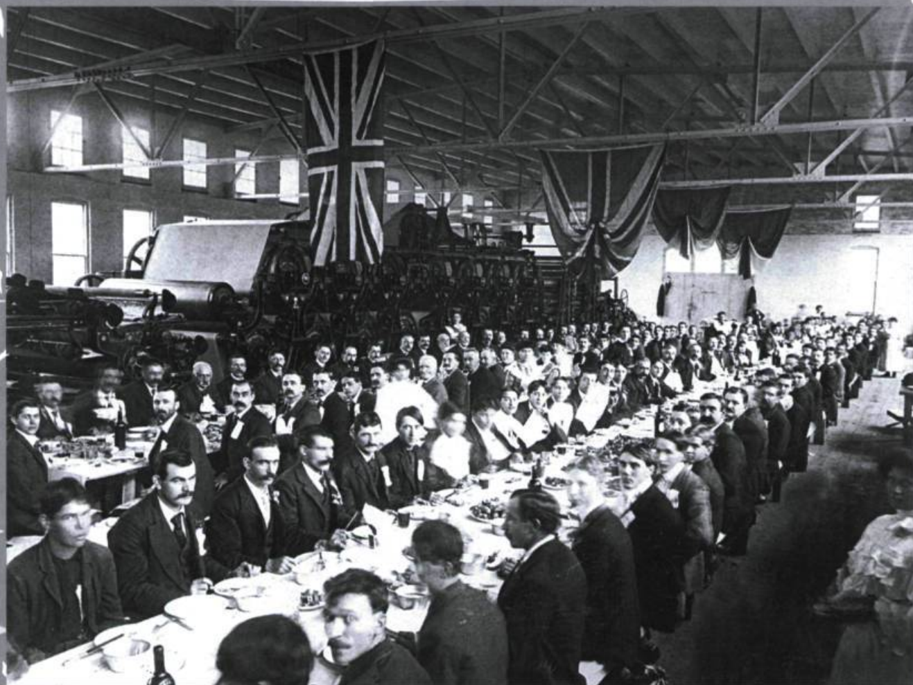
Banquet d'inauguration des moulins du Nord en 1904.