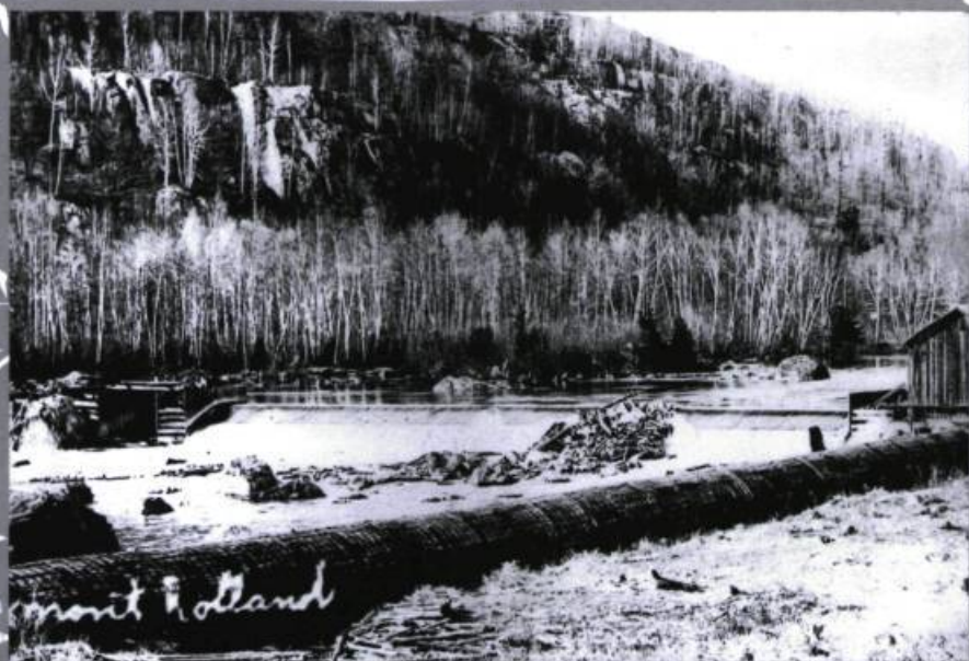
Première digue et tuyaux d'alimentation en eau pour l'usine construite en 1902-1903.