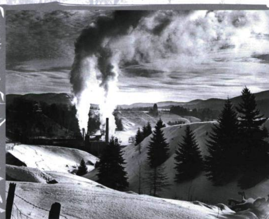
Tout au fond d'une petite vallée, l'usine de Mont-Rolland, en 1962.