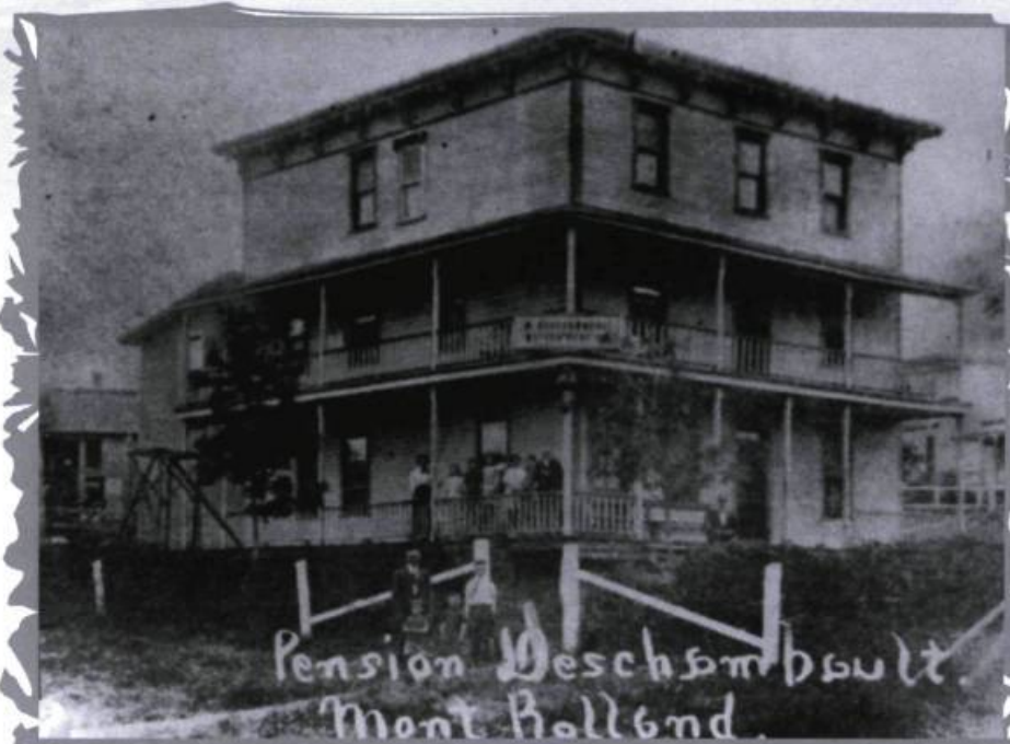
L'établissement hôtelier bâti par M. Groulx et vendu, en 1905, à M. Deschambault.

Le village de Mont-Rolland se situe au fond d'une petite vallée sur la rivière du Nord, à près de 40 kilomètres au nord de Saint-Jérôme. L'emplacement jouit d'une chute en escalier d'une hauteur de 30 mètres.