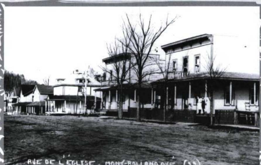
Rue de l'Église, Mont-Rolland, Québec.

Les plans de Stanislas Jean-Baptiste Rolland se concrétisent. L'arpenteur T. Charbonneau