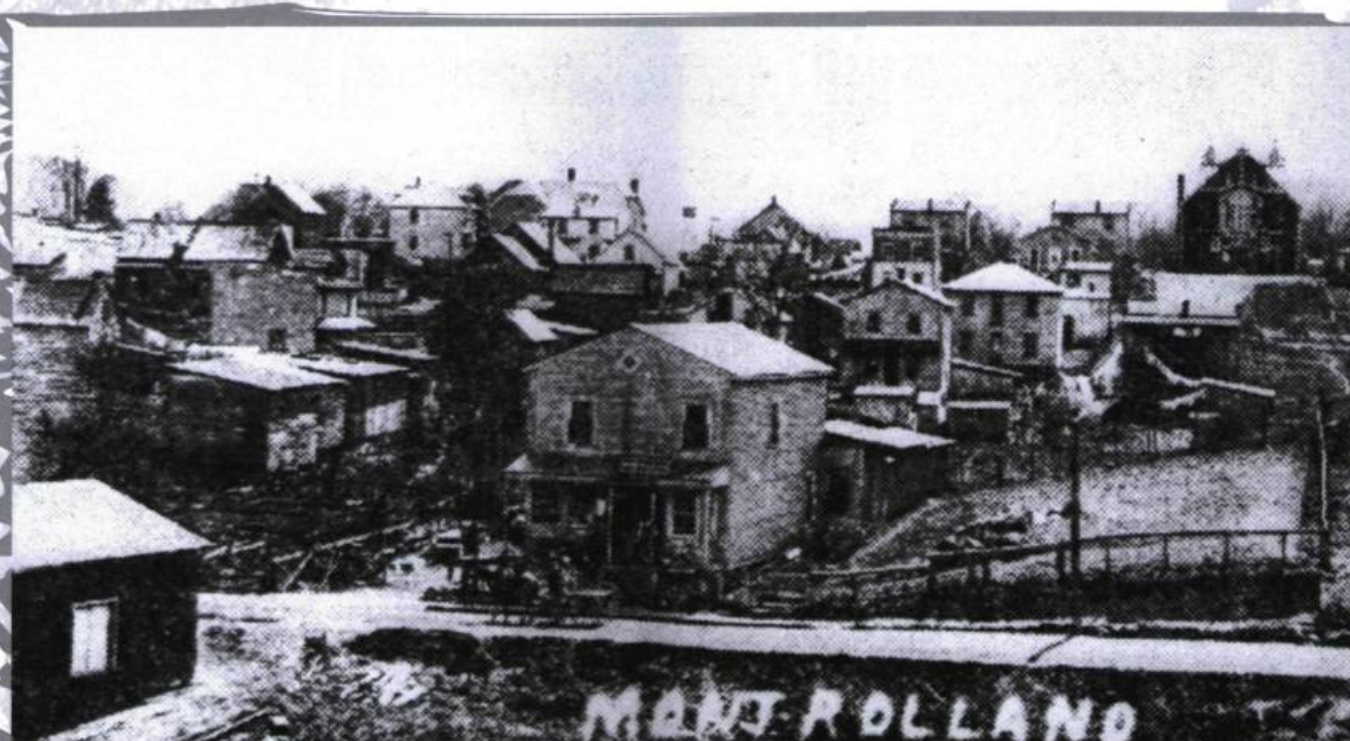
Vue générale du village avec l'église au fond, en 1920.

tous employés du moulin, discutaient entre eux dans les locaux de la compagnie et sur les heures de travail.