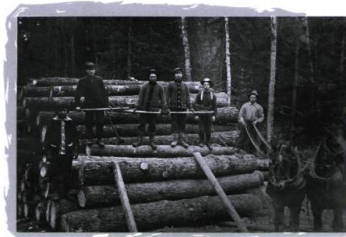
Empilage de billots, Outaouais, vers 1915.

On oublie trop souvent qu'il existe deux Outaouais, l'un fortement urbanisé et relativement prospère correspondant à la ville de Gatineau