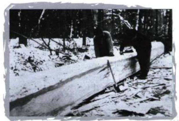
Équarrissage d'une pièce de pin, vers 1920.