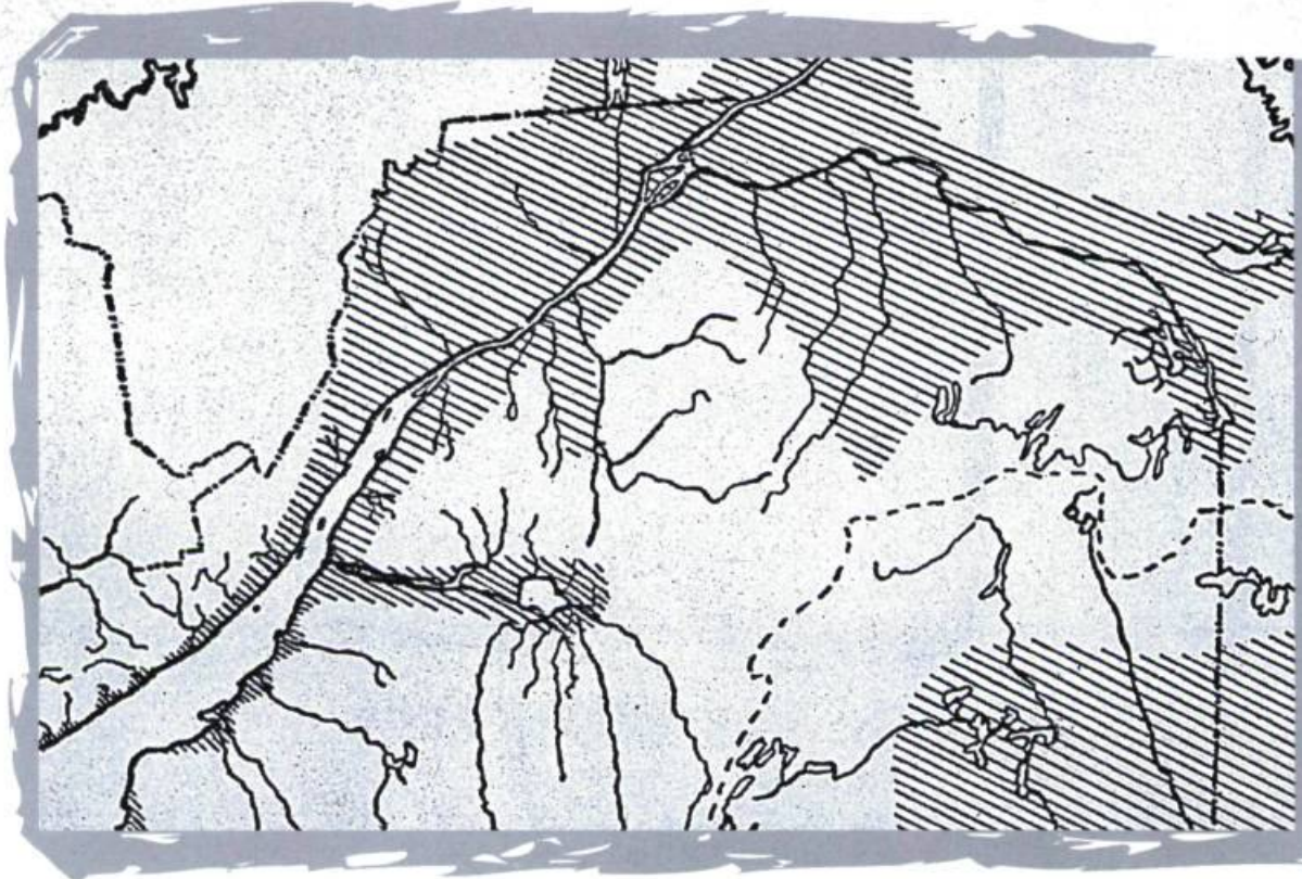
L'invasion marine maximale de la mer Champlain. Extrait de Initiation à la géologie de Laverdière.

Ces paysages sont marqués par une longue évolution géologique dont les principaux jalons sont : la création des Laurentides il y a plus d'un milliard d'années; l'invasion marine du Iapetus, au paléozoïque, il y a plus de 500 000 000 d'années; les glaciations du pléistocène il y a 1 600 000 ans; et