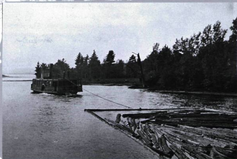
Remorquage de bois dans des estacades, région du Pontiac, vers 1906.