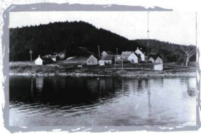
Un vestige de l'épopée de la traite des fourrures. Le « Vieux fort » du lac Témiscamingue vers 1930.

ainsi que ferment tour à tour les postes des Chats (1837), de Fort Coulonge (1855), de Fort William (1869) et le « Vieux Fort Témiscamingue » (1891), situé près de Ville-Marie.