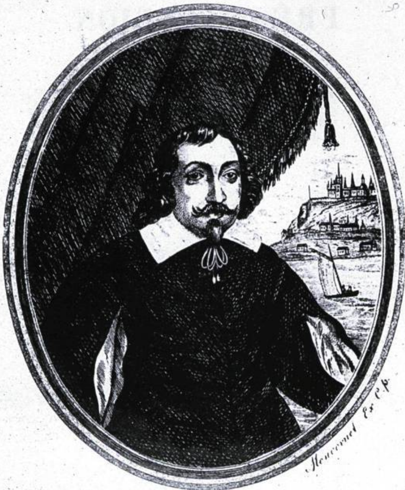
SAMUEL DE CHAMPLAIN Fondateur de Québec Capitale du Pays de Canada 1608

Plusieurs postes de traite jalonnent la « Grande rivière » jusqu'au milieu du XIX e siècle, comme autant de marqueurs qui rappellent l'importance considérable du commerce des fourrures dans l'Outaouais. Les principaux sont alors situés au lac des Deux-Montagnes (Oka), aux Chats (Quyon), au Fort Coulonge, au lac des Allumettes (Fort William), à des Joachims, à Mattawa et au Témiscamingue. Deux des plus importants, ceux de Fort-Coulonge et de Témiscamingue, remontent à l'époque de la Nouvelle-France. D'autres, moins importants et surtout moins connus, ont marqué pour un bref moment l'histoire de la région de Hull. C'est le cas de celui de Deschênes, auquel sont intimement liés Ithamar Day et les McConnell. Le commerce des fourrures, qui connaît son apogée sur l'Outaouais vers 1850, disparaît peu à peu, ruiné par la montée du mouvement de colonisation et le développement de l'industrie du bois. C'est