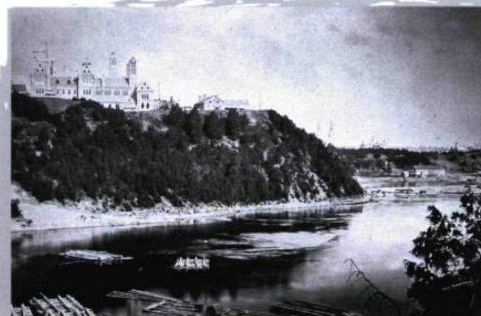
Rivière des Outaouais et radeaux de bois « carrés » avec en arrière-plan les édifices du Parlement en construction, vers 1860.

et à sa couronne périurbaine, et l'autre correspondant aux MRC Pontiac, Vallée de la Gatineau et Papineau, dont les caractéristiques