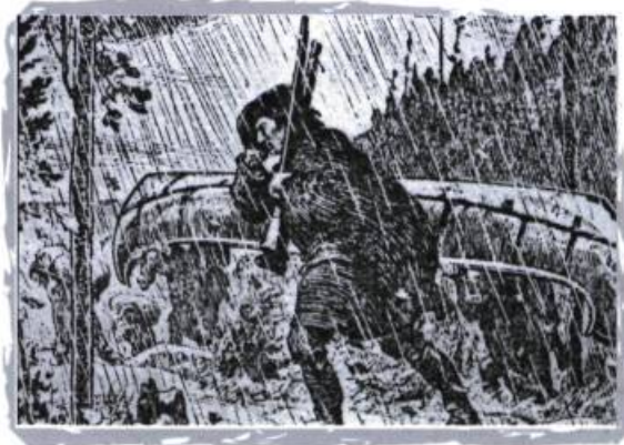
Dessin de Jeffries. Reconstitution du passage d'un sentier de portage. Collection Pierre Louis Lapointe.

« Ça se passe, dit-on, à l'époque des guerres iroquoises... Un groupe d'Algonquins campe sur les rives du lac des Fées (ou lac Hanté) épiant l'occasion d'attaquer les Iroquois... Parmi ceux qui s'y trouvent, il y a une belle princesse amérindienne que fréquentent assidûment deux jeunes et valeureux guerriers. Chacun d'eux rivalise d'ardeur et de promesses pour gagner le cœur de la belle. Mais elle tergiverse de l'un à l'autre, incapable de prendre une décision.