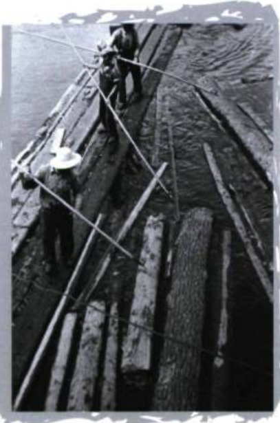
Opérations de triage de bois près de Bryson, vers 1910. Collection Pierre Louis Lapointe.

La rivière, axe de pénétration et outil de développement de l'ensemble de la vallée, devient éventuellement frontière. Peu à peu, les institutions