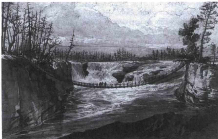
Illustration 5. Croquis du premier pont suspendu au-dessus des chutes Chaudière . 1827.

dirige, au printemps et à l'été, les cages de bois équarri qui descendent la rivière des Outaouais et le fleuve Saint-Laurent jusqu'à Québec. Ce travail demeure tout de même très exigeant puisque ces immenses trains de bois peuvent atteindre 500 mètres et être montés par un équipage de 80 cajeux, connus aussi sous le nom de «raftsmen».