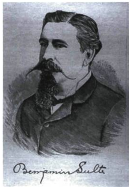
Illustration 4. Portrait anonyme de Benjamin Sulte . Gravure, Le monde illustré , vol. 4, n° 186, 26 nov. 1887, p. 237.

Après 1840, les exploits de Montferrand se font plus rares. Par ailleurs, il ne parcourt plus les chantiers de l'Outaouais en hiver comme autrefois. Maintenant, il