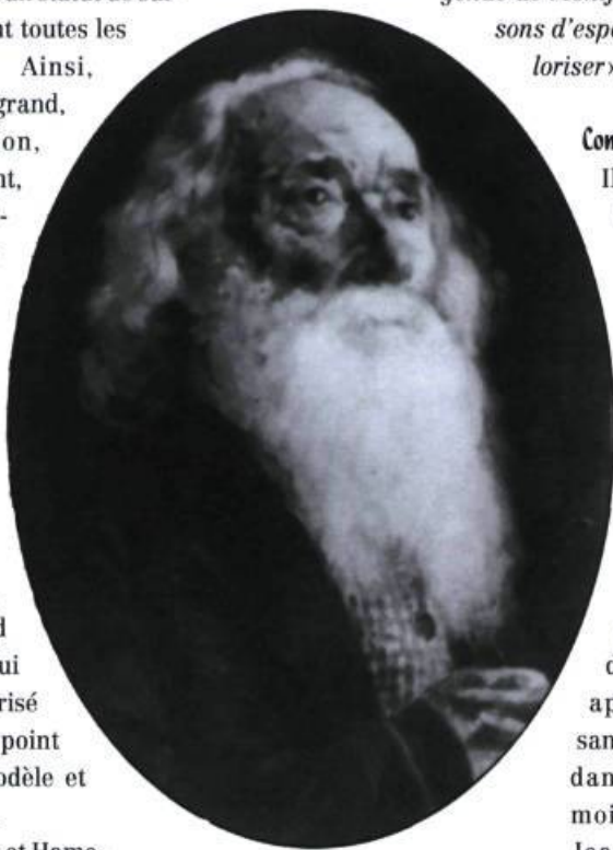
Illustration 6. Montferrand vers 60 ans , ANQ-Outaouais, v12-7, fonds Ville de Hull.

contre l'Anglais et contre la nature, les Canadiens français trouvèrent dans la légende de Montferrand des raisons d'espérer et de se valoriser. ».