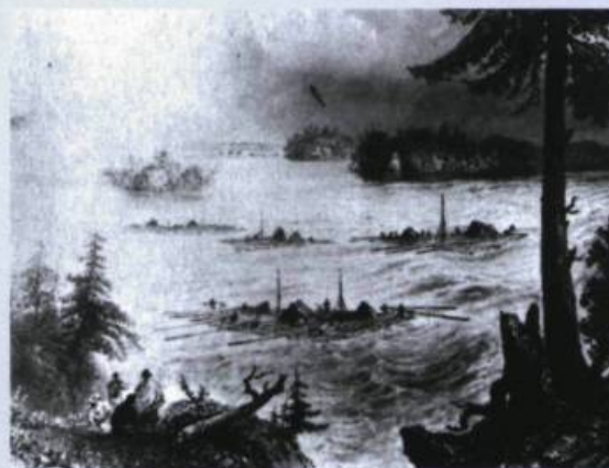
Des cageux à l'embouchure de la rivière Ottawa et du fleuve Saint-Laurent. Gravure de William Henry Bartlett

L e premier train de bois qui ait jamais flotté sur l'Outaouais déboucha de la Gatineau pour entrer dans la Grande Rivière. Son apparition donna lieu à un moment inusité parmi les paisibles villageois qui n'ignoraient pas l'entreprise aventureuse que l'on allait tenter. Les radeaux de bois descendirent de Hull, passèrent les rapides tourbillonnants du Long-Sault et arrivèrent à l'île de Montréal. Ce ne fut pas sans encombres et sans fortes dépenses. Comme les hommes au service de Wright ne savaient comment naviguer à travers les rapides, il ne fallait pas moins de trente-cinq jours pour les descendre. Souvent les radeaux s'échouaient et il fallait une longue manœuvre pour les remettre à flot, mais l'expérience apprit aux voyageurs à connaître le chenal et plus d'une fois ensuite les radeaux opérèrent la descente en vingt-quatre heures.