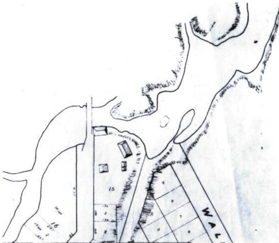
Illustration 5. Le site de l'ancienne brasserie en 1864 16

Wrightstown devenait la Ville de Hull suite à son incorporation en 1875. Cette nouvelle municipalité décidait en 1888 de s'approprier le site de l'ancienne brasserie, car elle espérait ainsi régler un conflit entre le nouveau propriétaire et son locataire, d'une part, le docteur Charles