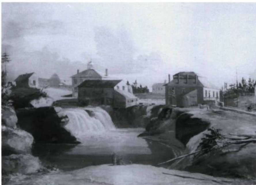
Illustration 3. Le moulin et la taverne de Philemon Wright à la chute des Chaudières en 1823 7

daient par bandes à Wrightstown pour venir se défouler chez nous. Ils semaient le désordre partout où ils passaient. Ils avaient le sentiment qu'ils pouvaient commettre n'importe quelles bêtises sans avoir à subir les conséquences de leurs actes. 6 Les exploits légendaires de Jos. Montferrand s'inscrivent dans ce contexte d'anarchie générale.