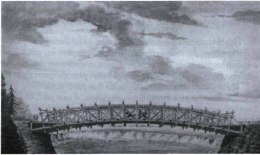
Illustration 4. Pont de bois au-dessus des chutes Chaudière, 1828. Aquarelle de John Burrows, ANC, C-16331.

en leur offrant cette liberté qui leur manquait tant de l'autre côté de la rivière.