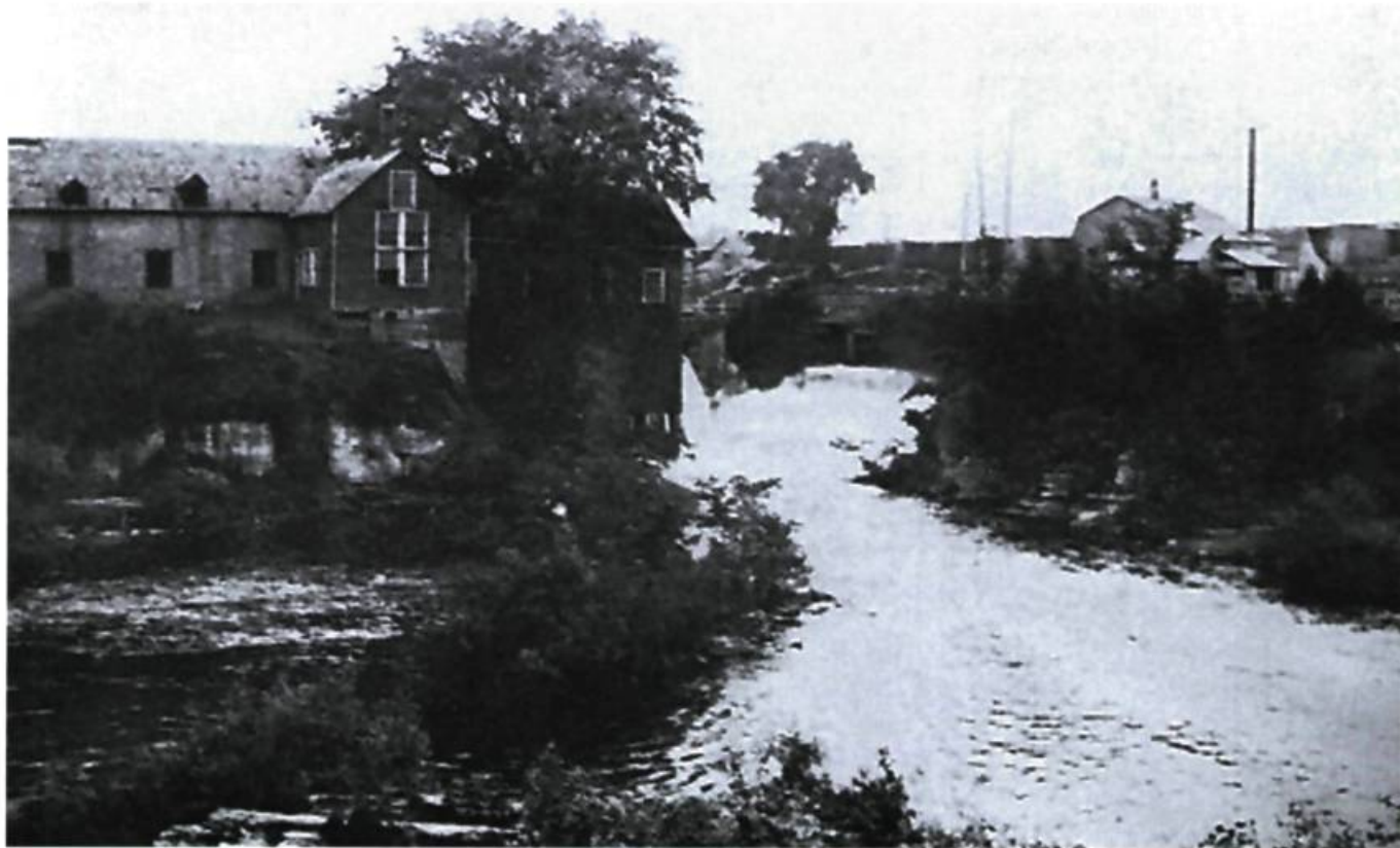
Illustration 6. Ancienne brasserie 12

La récente fusion municipale survenue en Outaouais rassemble en une seule ville les anciennes municipalités d'Aylmer, Hull, Gatineau, Masson-Angers et Buckingham. Elle a toujours du mal à se défaire de ce réflexe conditionné qui consiste à toujours vouloir faire disparaître ce qui pourrait témoigner de son passé, un passé dont elle a honte en secret sans trop savoir pourquoi. Par bonheur, elle arrive à se ressaisir. Elle s'est même dotée d'une politique qui vise à faire de Gatineau une «ville d'art et de culture». Mieux encore, le ruisseau de la Brasserie et la rue Montcalm sont en voie de devenir un axe de prestige au sein de la nouvelle ville. Gatineau semble enfin libérée de ses démons du passé.