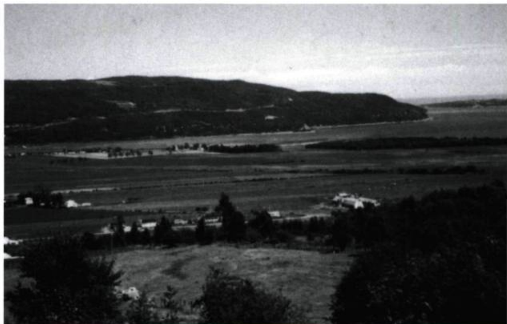
« Le Cap-aux-Corbeaux... vingt-huit arpents à descendre... »