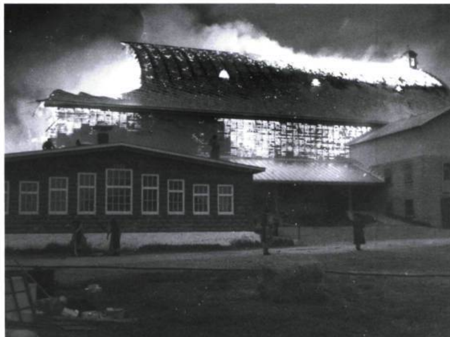
Le malheur a souvent frappé, le feu surtout.

Si l'on peut juger les hommes par l'héritage qu'ils laissent, les moines de l'abbaye Notre-Dame-du-Lac occupent déjà une place immense dans notre histoire. Où qu'ils aillent, après leur départ d'Oka, ils seront toujours près de nous.