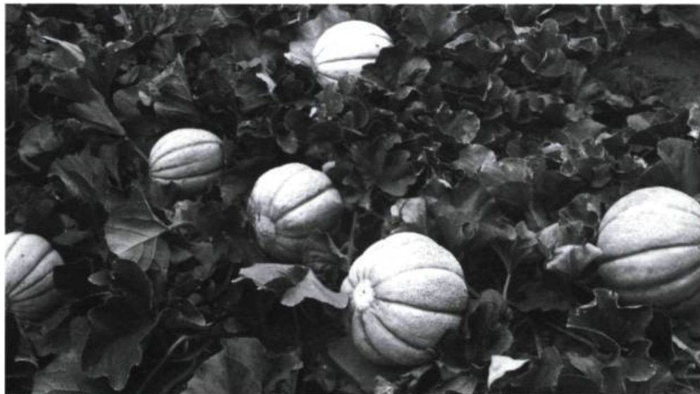
Les melon d'Oka fut longtemps populaire.

Considérés comme des experts dans le domaine agricole, les Trappistes ne tardèrent pas à organiser leur ferme modèle et leur école d'agriculture. Après le départ de Cyrille Gagnon et de sa famille du moulin, les moines occupèrent la vénérable construction et commencèrent à recevoir quelques élèves. Les trois premiers leur avaient été adressés par les Sœurs Grises de l'Institut d'Youville de Saint-Benoît. Quand les religieux prirent possession de leur premier monastère en pierre, on transporta l'école dans le vieux monastère de bois. Le vieux moulin n'abrita donc l'école d'agriculture