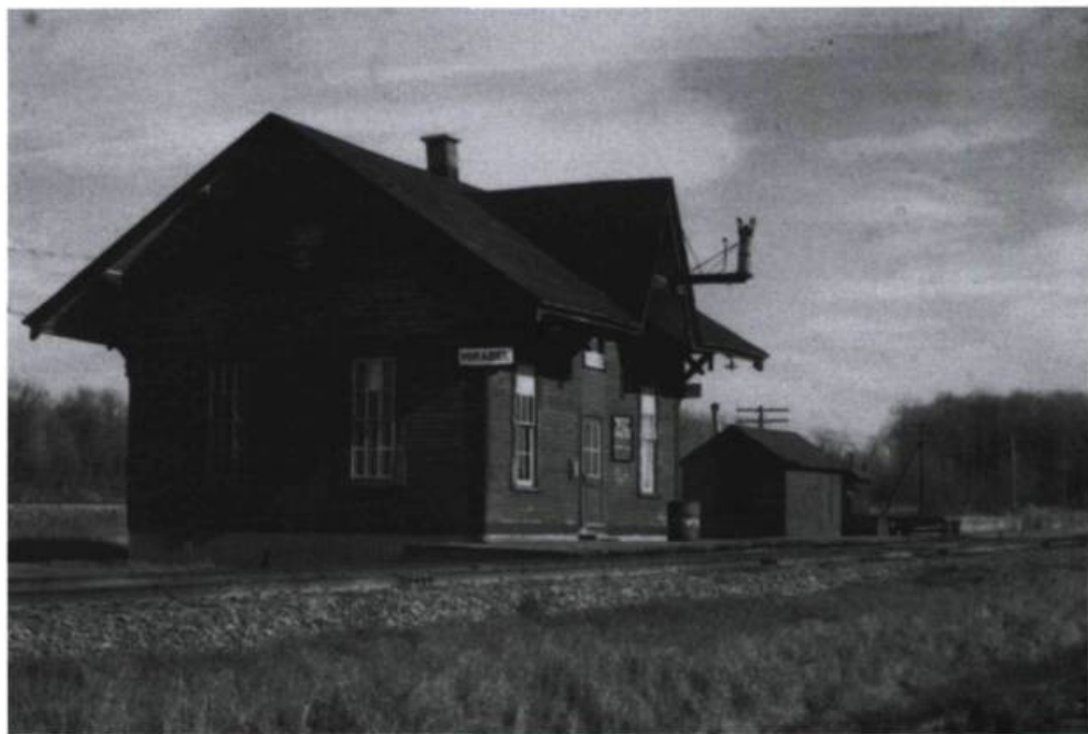
Les fonctionnaires ont fait détruite la gare.