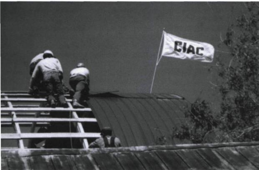
La fierté des expropriés: hisser leur drapeau

risation de bâtir... on hausse ton loyer et en plus tu es obligé de bâtir ta grange toi-même».