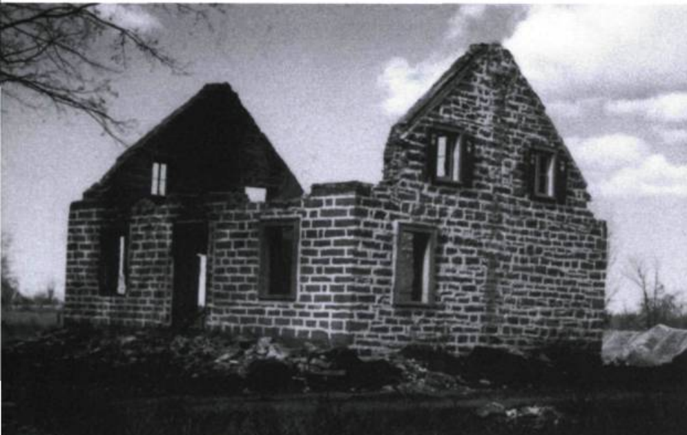
Le fédéral a incendié des maisons inutilement.

vateurs auraient été occupés dans leurs champs et Girard se serait retrouvé tout seul. Nous n'avions ni le droit ni l'intention de l'abandonner.