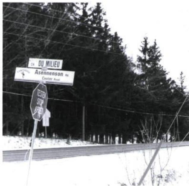
Figure 9 - Chemin du Milieu traduit en Iroquois (mohawk) et en anglais. (Photo J.-P. L.).

au cours des années 1740, 41 et 42, un calvaire sur la colline qui porte aujourd'hui ce nom. (73) Ce calvaire se compose de sept petits oratoires en maçonnerie, dont trois ont été érigés sur le sommet de la montagne et sont visibles de la route (344) et du lac. Les quatre autres, construits le long d'un sentier sur le flanc ouest, sont cachés par la forêt. Au début on installa dans ces petites constructions des tableaux illustrant les souffrances de la passion du Christ, mais on se rendit vite compte que l'alternance du froid, de la chaleur et de l'humidité les détériorait et on les remplaça par des bas-reliefs en bois peints de couleurs vives. Ces tableaux et ces bas-reliefs, symboles extérieurs de la religion, impressionnaient les Indiens et les incitaient aux piétés du chemin de la croix. Plus tard, à la fin du 19 e siècle, ce sont les Québécois qui vinrent nombreux en pèlerinage au calvaire d'Oka. Depuis plusieurs années cette pratique a été délaissée et, à la suite d'actes de vandalisme survenus au cours des années '70, les bas-reliefs ont été retirés des petits oratoires et remisés dans l'église où on peut encore les admirer. Ces petits oratoires sont parmi les plus vieilles constructions à l'ouest de Montréal (fig.7).