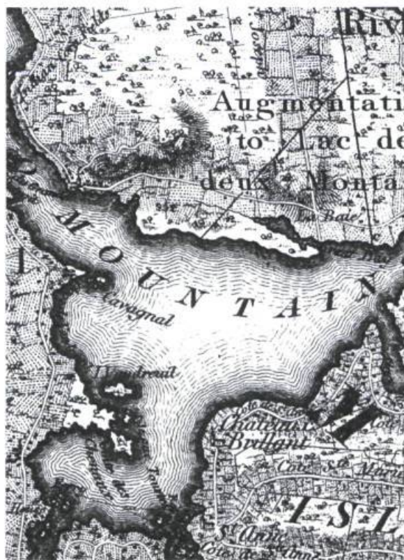
Figure 8 - Partie de la Carte topographique de la province du Bas-Canada, 1815. Jos. Bouchette.

Cette colline, la plus haute de la région (270 mètres), domine la partie ouest du lac. D'après Urgel Lafontaine, p.s.s., elle aurait été ainsi nommée par les Indiens, parce que, dans certaines conditions de temps, elle aurait, vue du lac, un aspect bleuté. Cet auteur ajoute même «...quand l'air est bien pur, et que les arbres sont dépouillés de leurs feuilles, on peut [du sommet] apercevoir jusqu'à vingt clochers.»(69) Sur les