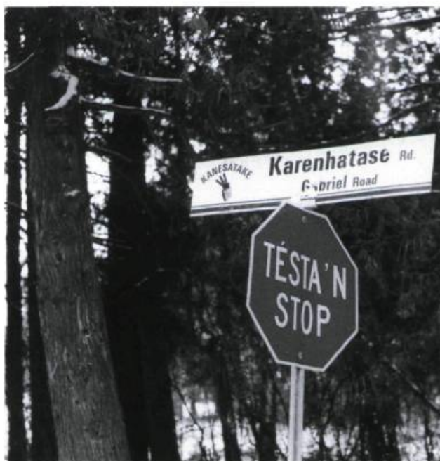
Figure 10 - Nouveau nom du chemin des Gabriel (Photo J.-P. L.).

rait tombé en désuétude faute d'usagers et aujourd'hui il a complètement disparu. En janvier 1978, un auteur se hasarda à traduire ce choronyme après en avoir modifié un peu son orthographe: