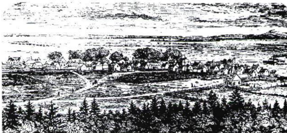
Figure 6 - C. E. Wilson, Vue d'Oka depuis les bancs de sable, 1878. Illustration tirée du New Dominion Monthly de Montréal , juillet 1878.

de ces dernières se trouve dans une note au procès-verbal du 7 avril 1977 : « Concernant le changement de nom de la municipalité, le sous-ministre Roch Bolduc suggère au conseil en date du 18 mars 1977 le nom de "Belmont" qui d'ailleurs est refusé par la municipalité. Le conseil maintient sa décision soit municipalité Paroisse d'Oka. » La Commission de toponymie refusa d'accéder à cette demande probablement parce que la municipalité voisine por-