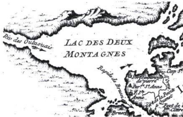
Figure 7 - Partie de la carte L'île de Montréal et ses environs, 1764. [Bellin], Petit atlas maritime.

Quelques années plus tard, le gouvernement agrandit considérablement le parc en achetant la colline du Calvaire, le secteur est de la plage, la Grande Baie et d'autres terrains à l'est et à l'ouest. (54) Actuellement le Parc d'Oka, car c'est son nouveau nom officiel, a une superficie totale