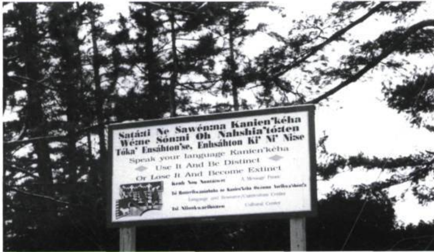
Figure 11 - Rédigée en iroquois et en anglais, cette affiche incite les jeunes Iroquois (Mohawks) à parler leur langue.

gue et de la culture iroquoises (mohawk). Asennenson est la traduction en iroquois de «chemin du Milieu», une appellation vieille d'environ cent ans et encore en usage, mais on peut penser qu'à plus ou moins long terme elle sera remplacée par la nouvelle appellation, du moins chez les Iroquois (Mohawks). Dans son Lexique de la langue iroquoise avec notes et appendices Cuoq indique au mot « asen , trois» et au mot suivant « Asennen ou asennon , milieu, entre deux, au milieu». (77) Plus loin en appendice il explique encore « Asen cf asennen . Les Iroquois ont dû se servir d'abord de leurs doigts pour compter. Les deux mots ci-dessus en fournissent une preuve sensible. De quelque côté en effet que l'on commence à compter, par le pouce ou par le petit doigt, le nombre trois (asen) se trouvera sur le majeur, au milieu de la main (asennen) ». (78) Le chemin du Milieu part du rang Sainte-Germaine en un point situé à égale distance des rangs Saint-Hyppolite et Sainte-Philomène, c'est peut-être là que se justifie son appellation, car son tracé n'est pas en ligne droite et il ne sépare pas un territoire en deux parties égales, mais évolue avec le relief et aboutit au chemin du Mille (79) près du village d'Oka.