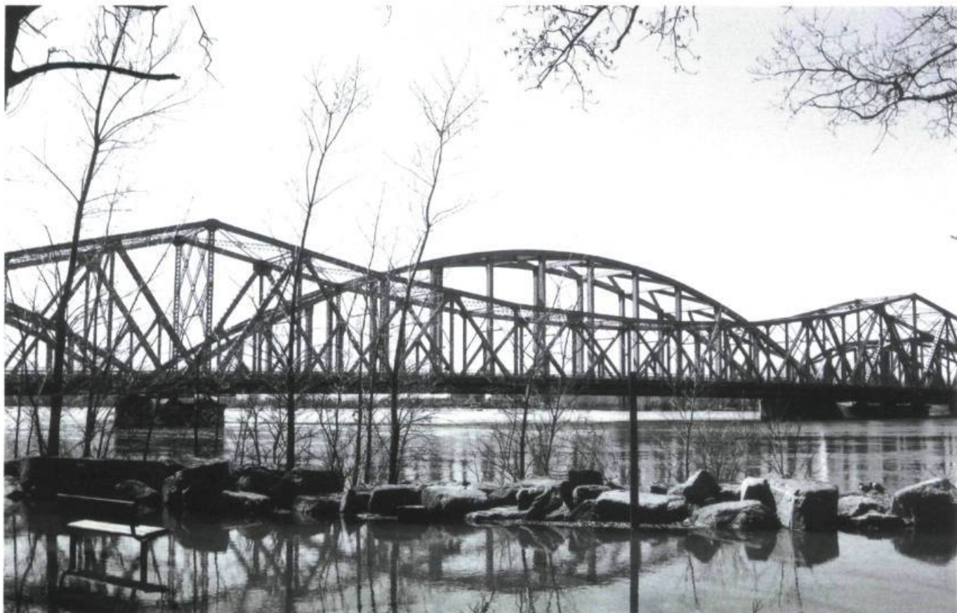
Le site du pont Lachapelle tel qu'il apparaît aujourd'hui depuis le parc Belmont, à Cartierville, sur le bord de la rivière Des Praires.

«Le Révd. Mr Quiblier, supérieur du séminaire, commença la cérémonie par adresser un discours aux assistants, dans lequel il leur fit remarquer que la religion avait toujours aimé et favorisé l'industrie; il dit que l'on devait rapporter à Dieu seul la gloire et le mérite de tout, et il fit aussi un éloge aussi délicat que bien mérité de l'homme industriel à qui la province est redevable de ce pont. Après cela eut lieu la cérémonie de la bénédiction.