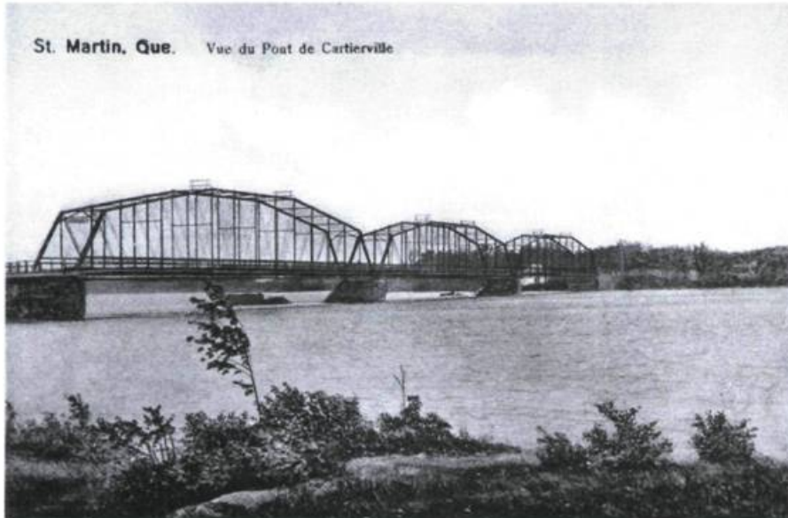
Le pont Lachapelle au début du siècle dernier.

«Chaque cheval, ou autre bête de somme, chargée ou non chargée, cinq deniers même cours. Chaque taureau, boeuf, vache et autres bêtes à cornes, de quelque espèce qu'elles soient, trois deniers même cours. Chaque cochon, chèvre, mouton, veau ou agneau, un denier et demi même cours.»