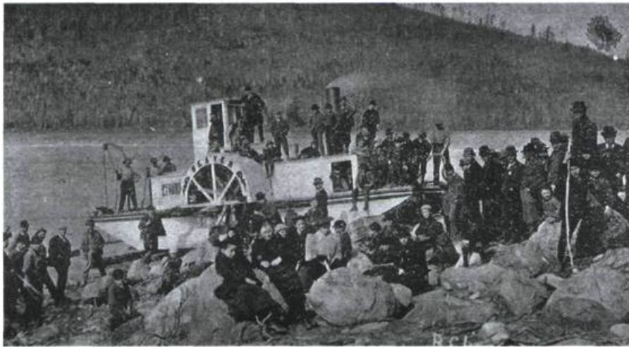
Une excursion en «vapeur».

« B ien sûr, ce sera pour les beaux mois de l'été ou de la fin du printemps. Dès les mois de mai, ce serait fort agréable». C'est ce que se disaient peut-être les gens de Montréal et des alentours quand ils parcouraient – en 1877 – les colonnes de La Minerve . Ainsi, l'édition du 9 juillet 1877 y faisait la réclame de la Compagnie de Navigation de la Rivière Ottawa.