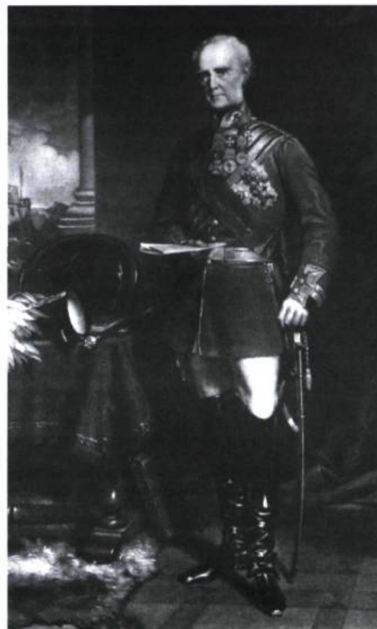
Sir John Colborne, commandant des forces armées au Canada pendant la rébellion.