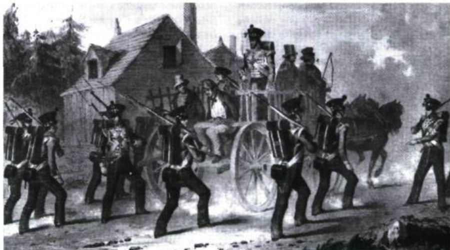
Des soldats anglais escortent des insurgés vers la prison de Montréal. (Dessin de M. A. Hayes gravé par J. H. Lynch, Archives Nationales du Canada)

Je m'attacherai ici à démontrer comment l'iniquité de ces procès a contribué à faire des Patriotes les martyrs et les héros des Québécois francophones. Ce sera une démonstration en deux parties : la première se voudra une mise en lumière des iniquités perpétrées sous l'égide de la Loi martiale en 1839 et qui ont valu aux condamnés la sympathie de la population. Les emprisonnements, la composition du Tribunal militaire et le déroulement des procès y seront successivement abordés. La seconde partie de ce travail s'attachera à démontrer que les condamnés de 1839 sont bel et bien demeurés des martyrs dans la mémoire collective du Québec, et ce jusqu'à nos jours. Cette partie se subdivisera en cinq points d'analyse, soit (1) l'historiographie canadienne-française, (2) les