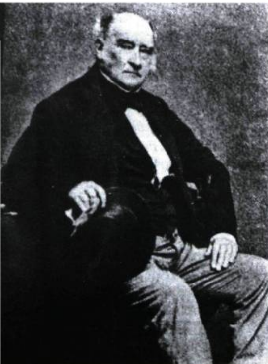
Le procureur général Charles Richard Ogden, qui collaborera étroitement avec Colborne pour écraser la rébellion.

En fait, la cour martiale ne permettait même pas aux accusés d'être défendus verbalement par leurs avocats devant le tribunal. Le seul droit des patriotes était celui de consulter leurs avocats, et encore, ce droit ne pouvait s'exercer que pendant les intervalles entre les séances. Le rôle des défenseurs était limité, dans la salle d'audience, à celui de simple spectateur. En