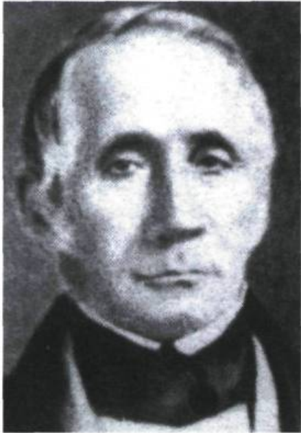
Amable Dionne, commerçant à Kamouraska et homme politique influent