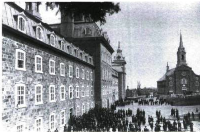
Cour avant du Collège de Sainte-Anne en 1916.

Et au collège, dans ce cher collège, quel deuil immense, quel vide irréparable?