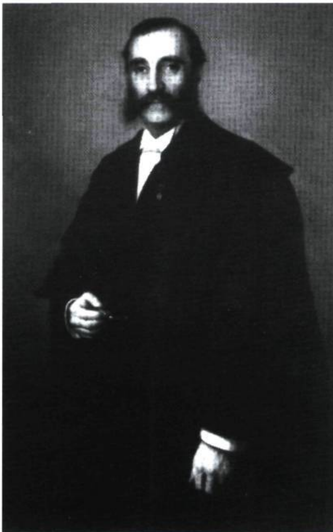
Félix-Gabriel Marchand (1832-1900)

La tenue de ce colloque me permet de souligner que l'année 1997 coïncide avec le centenaire de l'accession de Félix-Gabriel Marchand au poste de premier ministre du Québec le 24 mai 1897.