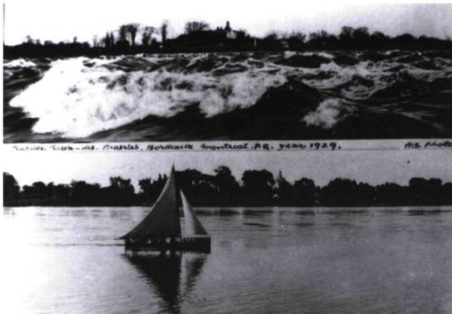
Ces deux clichés ont été réalisés au même endroit, à Bordeaux, celui du haut en 1929 et l'autre, en 1931. Submergés par l'élévation du niveau de l'eau résultant de la construction de la centrale du Sault-su-Récollet, les flots regeurs du Gros-Sault se sont transformés en une surface calme.