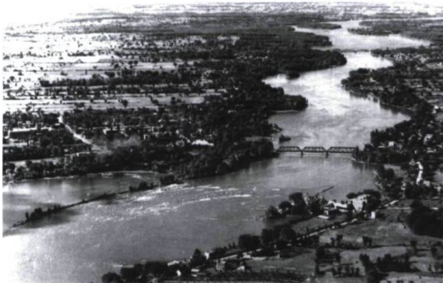
Cette photo prise vers 1928 par la Royal Air Force représente la rivière des Prairies à la hauteur du pont ferroviaire de Bordeaux. On y distingue la longue jetée prolongeant l'île Perry. En face, le moulin du Crochet de l'île Jésus. Même à cette altitude, le Gros-Sault demeure rageur.

Entre 1717 et 1748, 45 colons se fixèrent sur autant de terres dans le Haut-du-Sault. En 1726, l'arpenteur René de Couagne pria l'un de ses confrères de border la terre 405 ; s'il ne s'acquittait pas lui-même de ce travail, c'est sans doute avec bonne raison : deux ans plus tard, en effet, il obtenait la concession du lot au