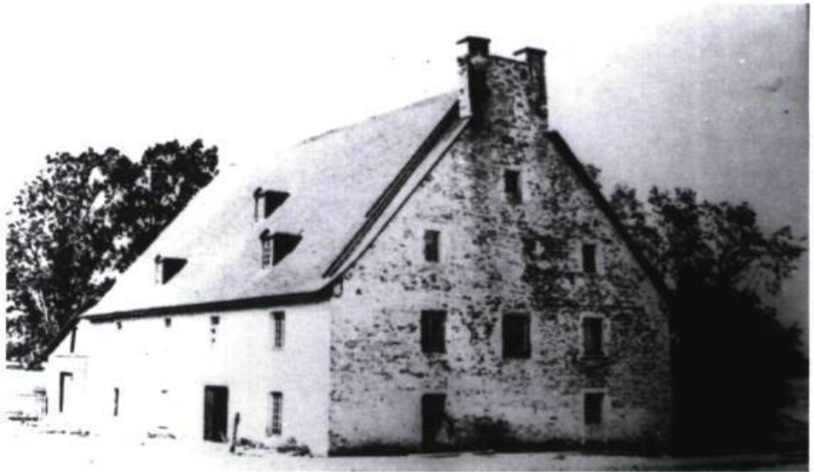
Le moulin du Gros-Sault d'après l'une des très rares photos qui en subsistent, et que l'auteur a trouvée en 1939 dans l'album d'une famille du Sault-au-Récollet. Sa maçonnerie semblait liée par un mortier qui défait l'usure du temps.

Il fallut recourir à de la poudre pour abattre la massive double cheminée du moulin qui s'obstinait à demeurer debout.