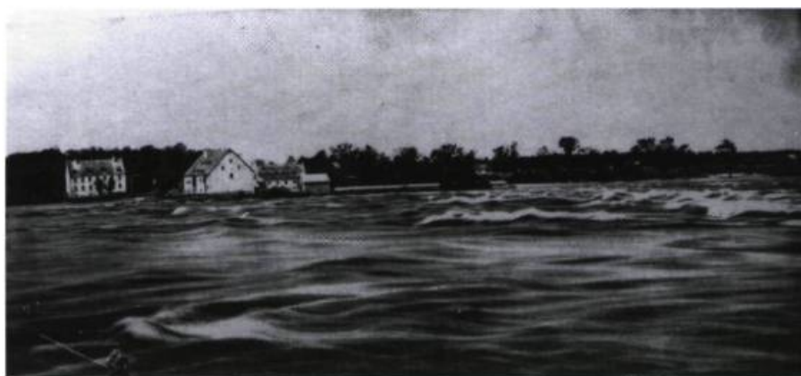
Même en face de l'Abord-à-Plouffe, la rivière des Prairies était turbulente, comme le démontre cette photo de Notman (musée McCord).

Hélas, ils ne peuvent rembourser un emprunt effectué en 1867 pour apporter des réparations et des améliorations à la propriété, qui se complétait d'installations pour carder et fouler la laine.