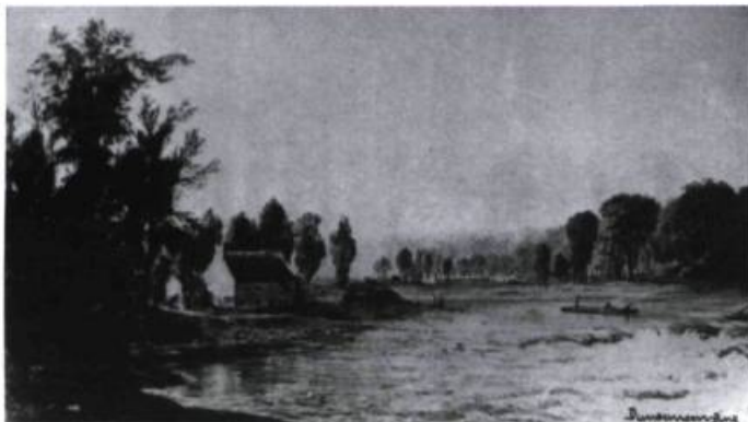
Ce dessin ancien signé Duncanson Pinx semble représenter le moulin du Gros-Sault et la décharge de son canal, alors qu'un radeau défie les eaux tumultueuses.

en eau calme, en aval de l'île de la Visitation, les hommes retournaient à l'Abord-à-Plouffe en voiture prendre charge de d'autres radeaux. Sur leur passage, rap-