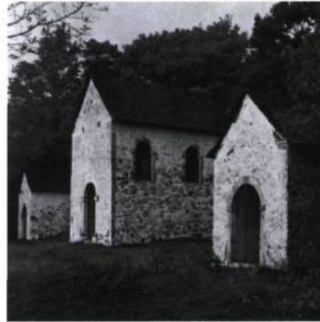
Les trois dernières chapelles du Calvaire d'Oka. Photographie prise en 1974.

Aujourd'hui qu'en est-il? Alors que nous nous apprêtons à basculer dans un nouveau millénaire saurons-nous témoigner au Calvaire d'Oka assez d'attentions, de soins, assez d'amour pour que la présence rassurante des oratoires et des chapelles du chemin de croix guident encore longtemps le promeneur, à travers bois, jusqu'en haut