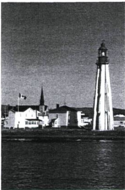
Le phare De Pointe-au-Père.