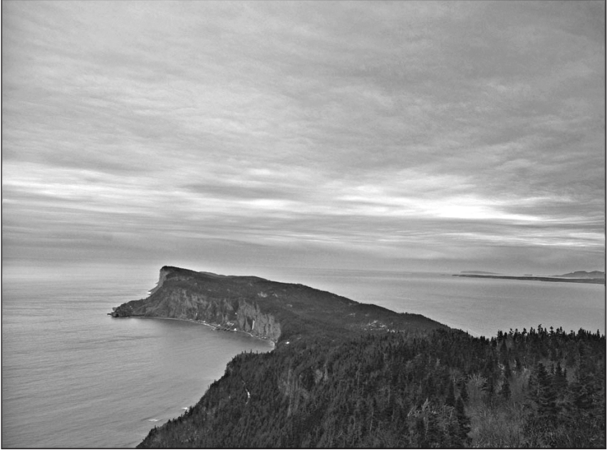
vue du mont Saint-Alban, avril 2012. ↑