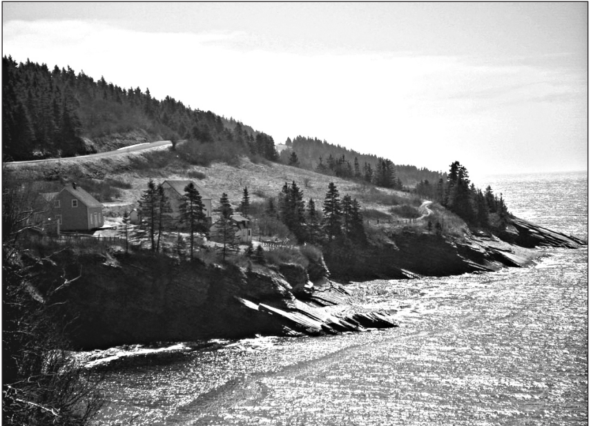
Anse-Blanchette, avril 2012. ↓