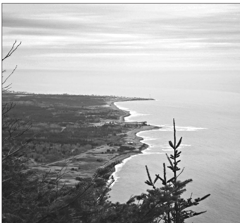
Cap-des-Rosiers, mai 2012. ↓