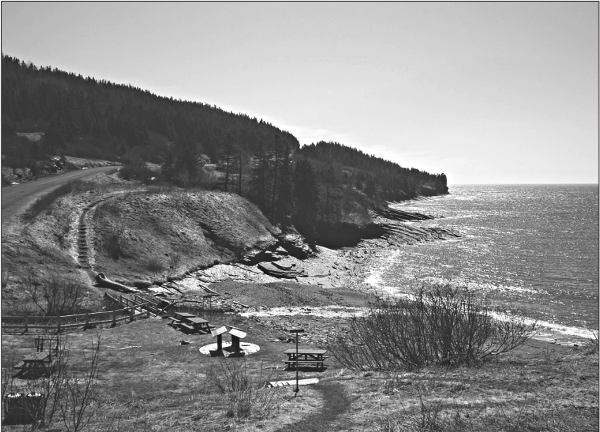
Anse-Saint-Georges, avril 2012. ↓