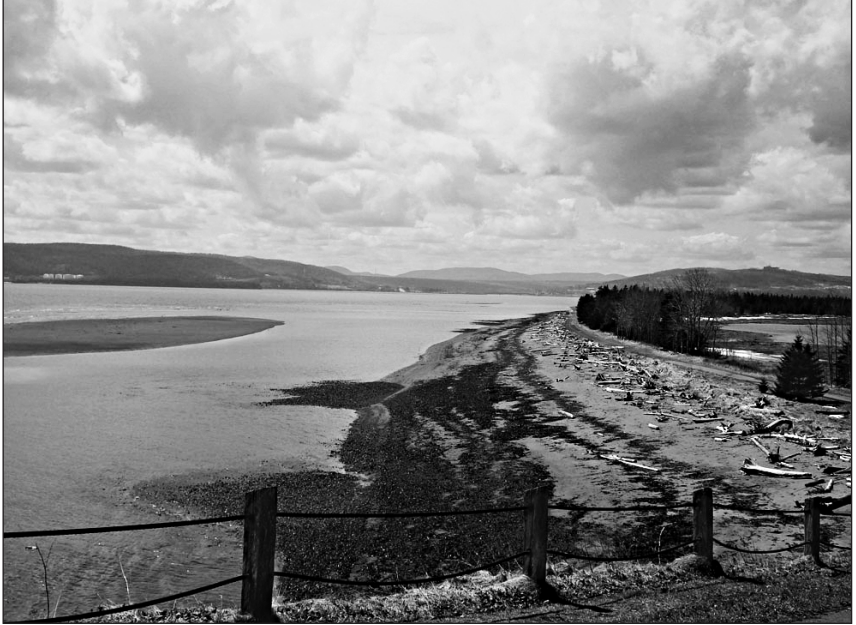
Penouille, avril 2012. ↑