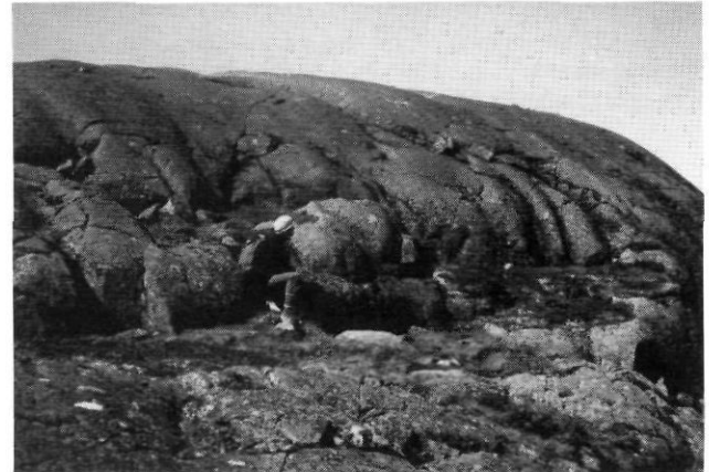
FIGURE 4. Moulure amont d'un rocher profilé dans du basalte; région du lac Guillaume-Delisle, Québec subarctique (7-8-82).

A large-size streamlined outcrop in basalt, top of a cuesta in the area of Lac Guillaume-Delisle (Richmond Gulf), Hudson Bay (8-7-82).