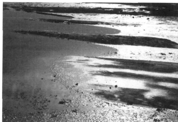
FIGURE 7. Rocher profilé de petite taille dans des schistes ordoviciens, en Minganie; zone intertidale à la pointe des Morts, près de Havre-Saint-Pierre, Côte-Nord du Saint-Laurent. Écoulement vers la gauche (20-7-78).

A large-size streamlined rock ridge in crystalline rocks; Canadian Shield in the area of Lac Bienville, subarctic Québec. Ice flow was from right to left (8-3-75).