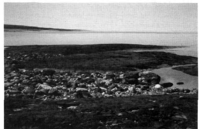
FIGURE 5. Rocher profilé de taille moyenne dans du basalte, côté ouest de la péninsule des Manitounouc, mer d'Hudson. Écoulement glaciaire vers la droite (15-7-81).

The upstream moulded side of a streamlined outcrop in basalt, in the area of Lac Guillaume-Delisle (Richmond Gulf), subarctic Québec (8-7-82).