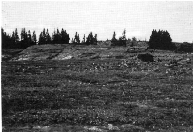
FIGURE 2. Rocher profilé de taille moyenne, dans du basalte, sur un revers de cuesta dans la péninsule des Manitounouc, Hudsonie. Écoulement glaciaire vers la droite (15-7-82).

Cette définition, qui ne fait aucune allusion à la présence de roc dans les drumelins, correspond à l'idée générale de la majorité des spécialistes et non-spécialistes, à savoir une forme glaciaire constituée principalement de matériel meuble. S'il est relativement facile d'admettre la présence d'un noyau rocheux dans certains drumelins ( rock-cored drumlins ), il est hasardeux d'affirmer qu'il en existe d'autres entièrement constitués de roche consolidée. Plusieurs auteurs (TARR, 1894; GRAVENOR, 1953, p. 678) l'ont pourtant fait, introduisant alors une certaine confusion. Ainsi, FLINT (1971, p. 104) parlant des streamlined moulded forms reconnaît qu'elles affectent aussi bien les substrats rocheux que les substrats meubles. Il y voit la gradation suivante: «BEDROCK: whale-back bedrock forms including stoss-and-lee forms → drumlins