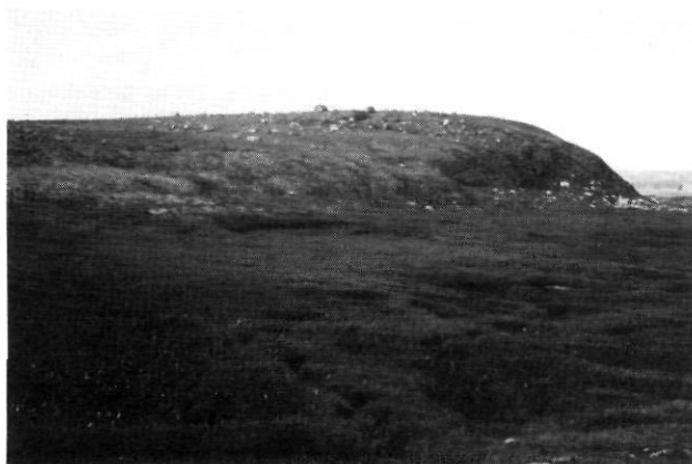
FIGURE 3. Rocher profilé de grande taille dans du basalte; revers de cuesta dans la région du lac Guillaume-Delisle, Hudsonie, (7-8-82).

A medium-size streamlined rock ridge in basalt, back slope of the Manitounuk Peninsula cuesta, Hudson Bay. The glacier moved from left to right (7-15-82).