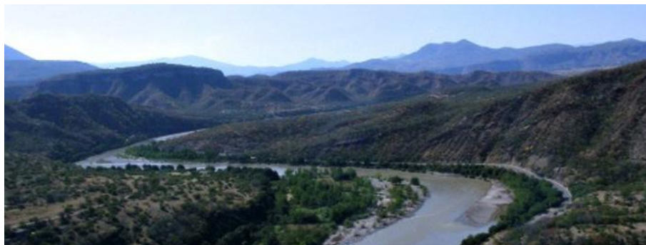
Le Haut Balsas, Guerrero, Mexique.

Ce sont les communautés nahuas du Haut Balsas (Figure 1) qui serviront à illustrer mon propos. Elles se sont installées dans cette région de l'ancien Guerrero, au Mexique, il y a au moins huit cents ans si l'on en croit les documents archéologiques et historiques (Paradis, 2001, 1995; Barlow, 1948). L'archéologie nous les révèle par la présence de nouvelles traditions céramiques dont certaines locales et d'autres importées du bassin de Mexico. C'est autour de 1270, ou même auparavant, que les premiers groupes nahuas, les Coixca, pénètrent dans le nord du Guerrero en provenance du Michoacan (Tableau 1). Ils sont en relation avec les autres groupes nahuas qui s'étaient installés dans le bassin de Mexico (Mexico) et le Morelos (Tlahuica) quelque temps auparavant. Quelques siècles plus tard, entre 1427 et 1440, survient la première conquête du Nord