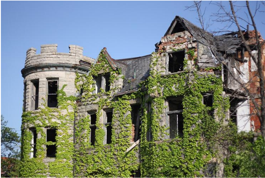
Un manoir recouvert de lierre ou une « feral house » dans Cass Corridor.