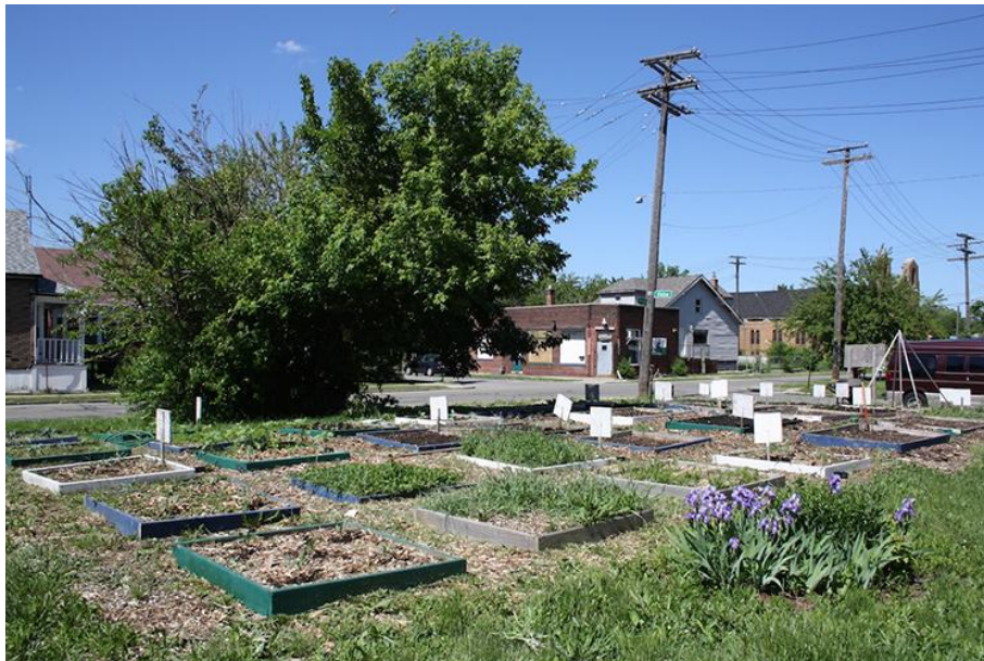
Jardin communautaire du Georgia Street Community Collective dans l'East Side.