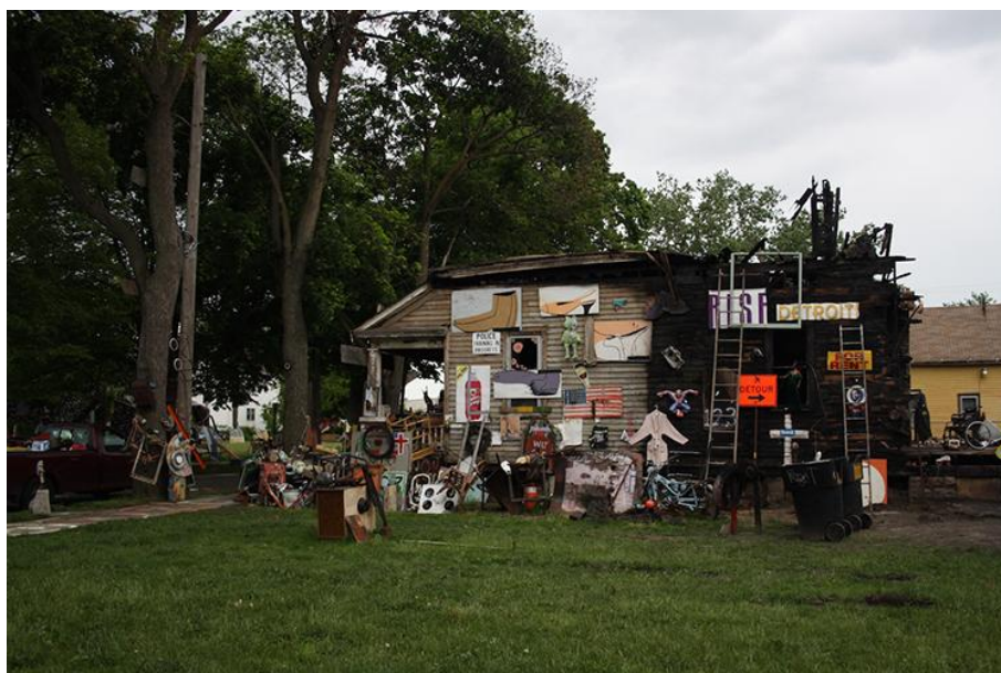
Une installation du Heidelberg Project.