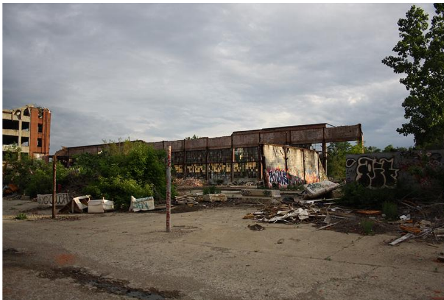
Les ruines de la Packard Plant dans l'East Side.