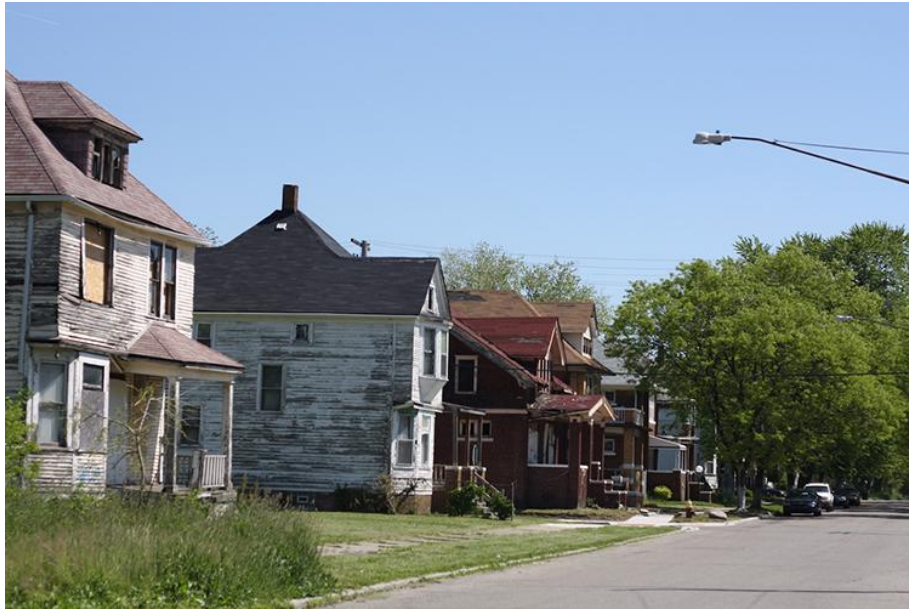
Maisons abandonnées dans l'East Side.