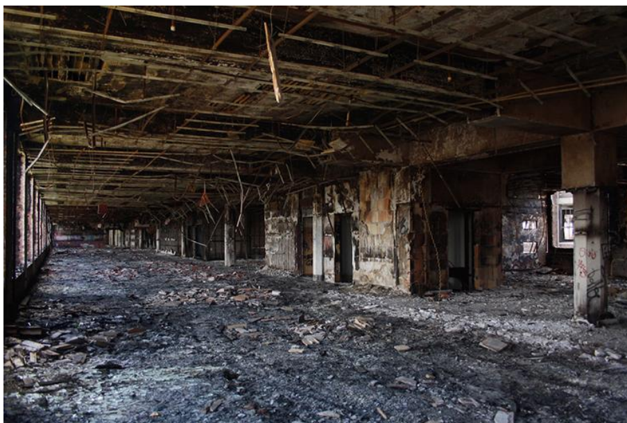
L'intérieur dévasté de la Packard Plant.