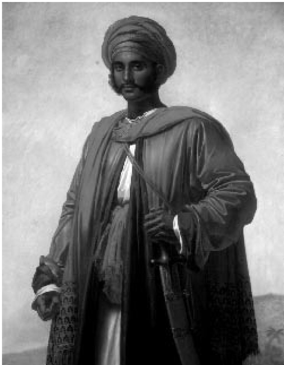
Figure 2. Anne-Louis Girodet (1767-1824), Un indien , 1807. Huile sur toile, 145 x 113 cm, Montargis, Musée Girodet.