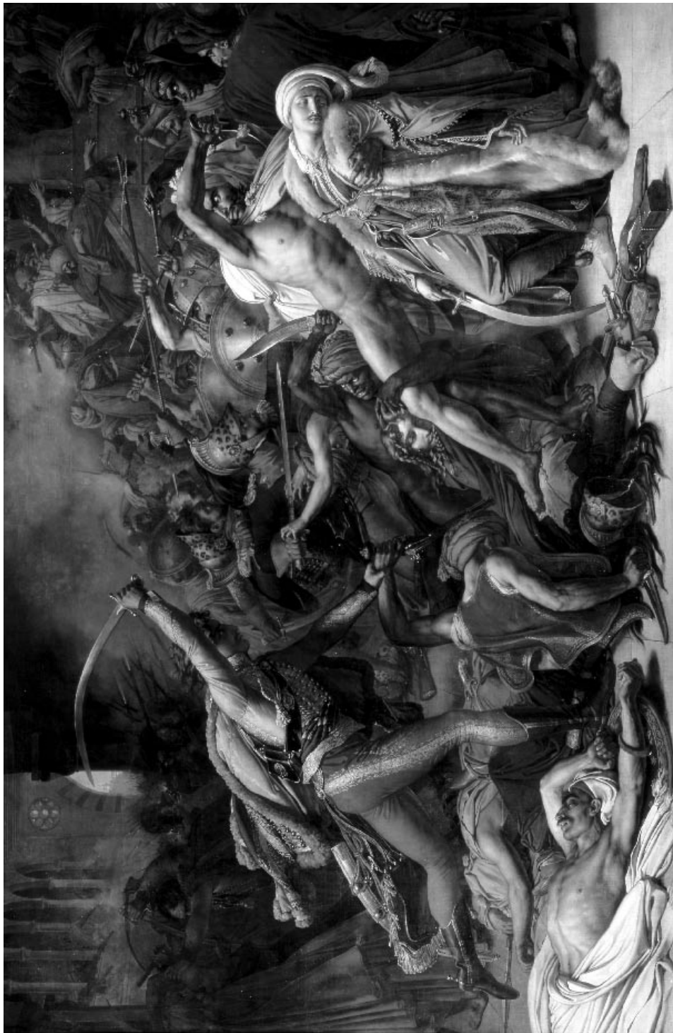
Figure 3. Anne-Louis Girodet (1767-1824), La révolte du Caire, 1810. Huile sur toile, 356 x 500 cm, Versailles, Musée du Château.