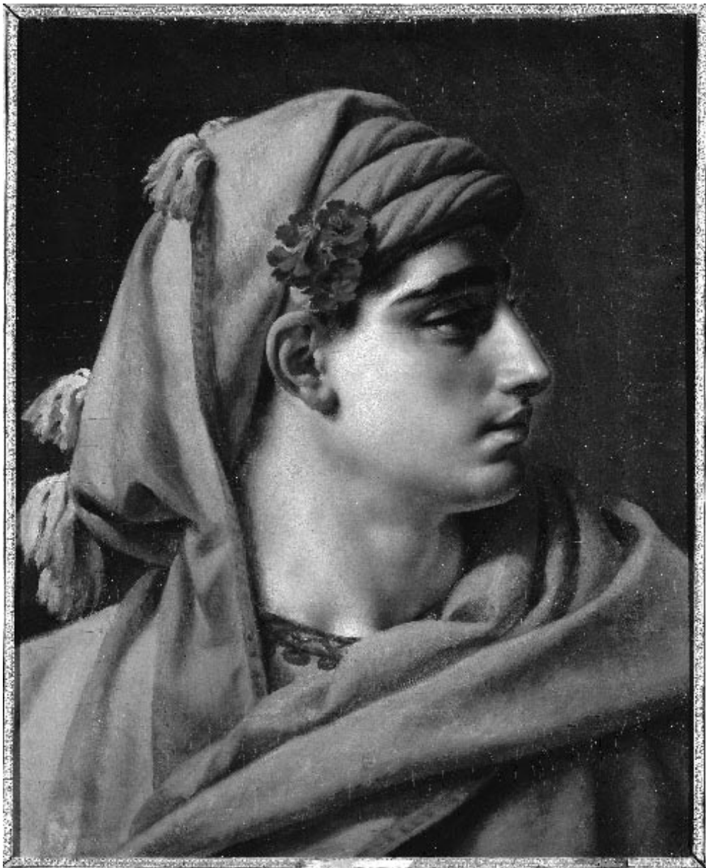
Figure 4. Anne-Louis Girodet (1767-1824), Étude d'une tête de Mamelouk, vers 1810. Huile sur toile, 78 x 63 cm, Paris, Musée du Louvre.