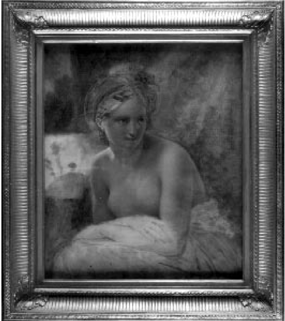
Figure 5. Anne-Louis Girodet (1767-1824), L'odalisque , 1812. Huile sur toile, 42 x 30 cm, Montargis, Musée Girodet.