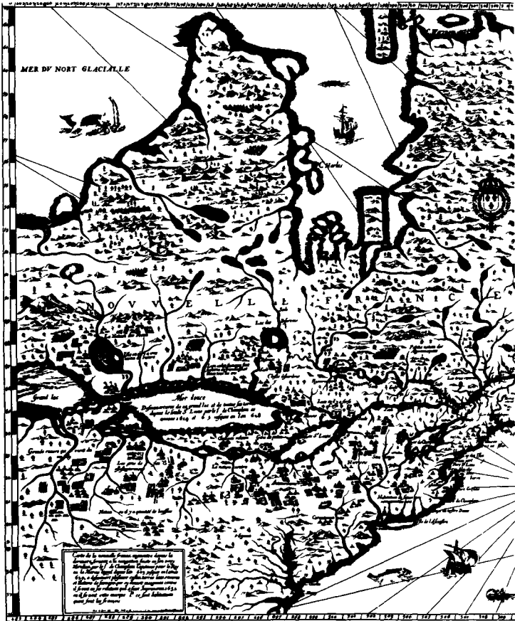
«Carte de la nouvelle France ( ) par le sieur de Champlain», dans Voyages , Paris, 1632, reprod. éd. Laverdière, vol. III.»