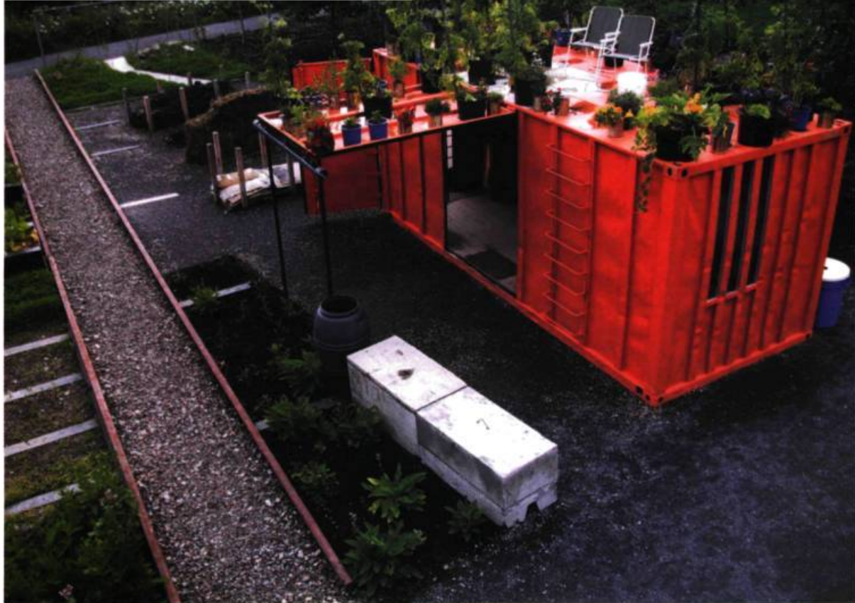
Mousse d'Architecture de paysage, Unité d'Intervention Mobile , 2004.

that soil, then a diverse and ecologically balanced life, then that is a wonderful sculpture. [...] But we have to create the chisels and we have to create the tools and we have to isolate the problem : where the block pollution is, so we can carve it away. It became very clear to me that ("Revival Field") would be a sculptural project worth engaging in. » 4