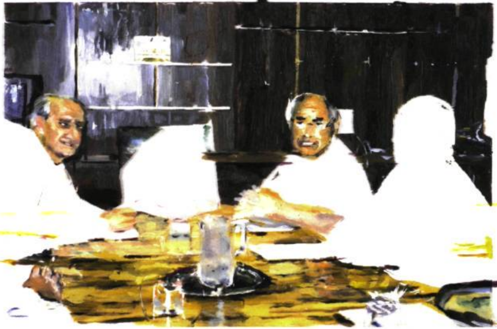
Dierk Schmidt, Operation relex... (Agir sans coupables 1) , 2003. Huile, acrylique sur une bâche en plastique pour étang de jardin. On y voit le Premier ministre australien John Howard et son ministre de l'immigration Philip Ruddock, « Operation Relex » est le nom d'une opération militaire qui fut mise en place le 3 septembre 2001 pour empêcher désormais les bateaux de réfugiés de s'approcher des côtes australiennes.

sables de l'immigration. Elles présentent également une paisible surface de la mer comme le possible lieu de crime, ou encore les membres du gouvernement australien en réunion et en action. Ainsi se construit une réalité historique qui non seulement dévoile les ficelles de son montage mais révèle aussi, grâce aux possibilités de la fiction picturale, la dimension tragique et cynique de ce drame. Car la légèreté de ces belles images colorées contraste avec l'impudence qu'elles dépeignent. En fait, en inversant le procédé des médias télévisuels qui, eux, ont renoncé aux investigations pour privilégier les effets immédiats produits par l'image choc, Schmidt pointe précisément le décalage entre le signifiant et le signifié, à savoir la difficulté de trouver aujourd'hui une représentation picturale appropriée. C'est en cela que sa peinture d'histoire affiche sa contemporanéité.